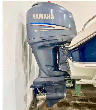
Pursuit 310 Sport Engines