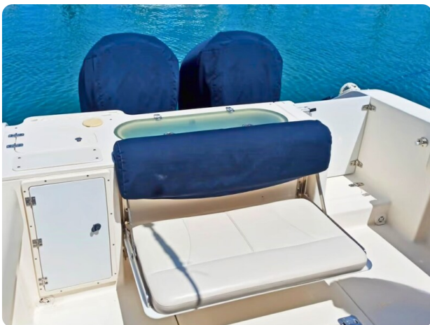
Pursuit 310 Sport Aft Seats