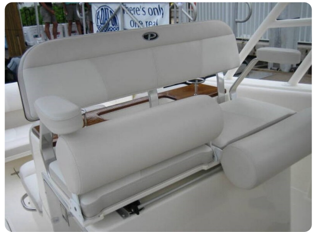
Pursuit S310 pilot seat