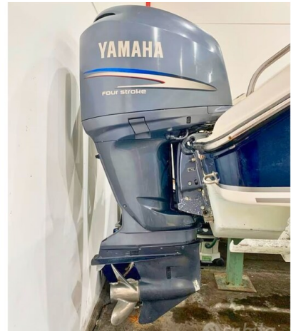
Pursuit 310 Sport Engines