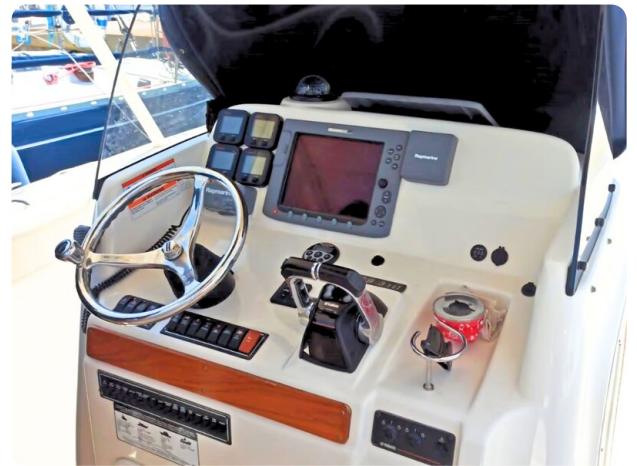
Pursuit 310 Sport Helm Station