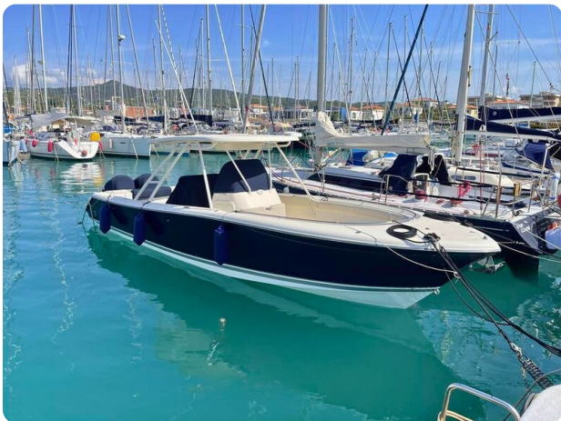
Pursuit 310 Sport Stb Fwd Profile