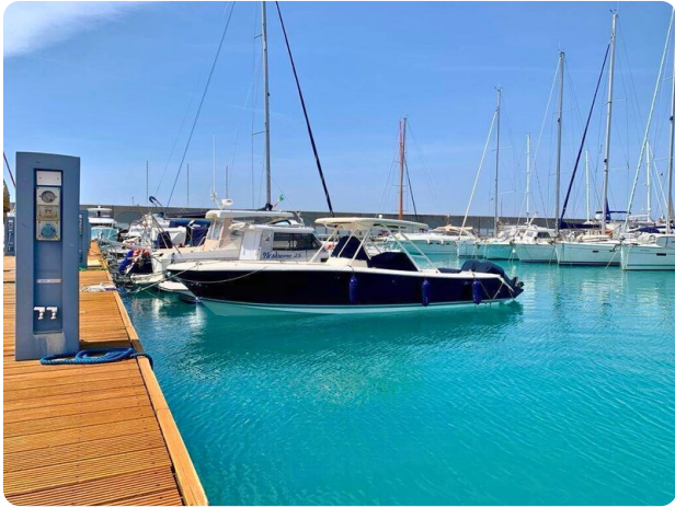
Pursuit 310 Sport Profile