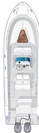
Pursuit 310 Sport Layout