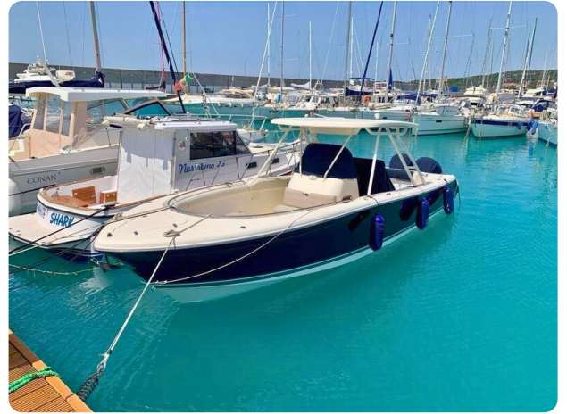
Pursuit 310 Sport Fwd Port Profile