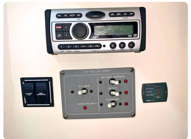
Pursuit 310 Sport Panel