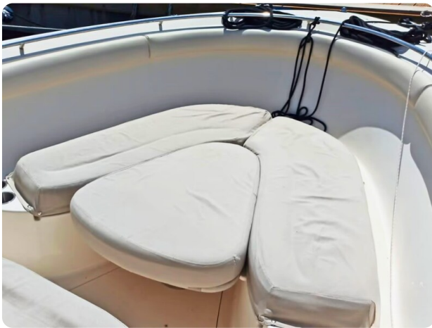
Pursuit 310 Sport Bow Sunpad