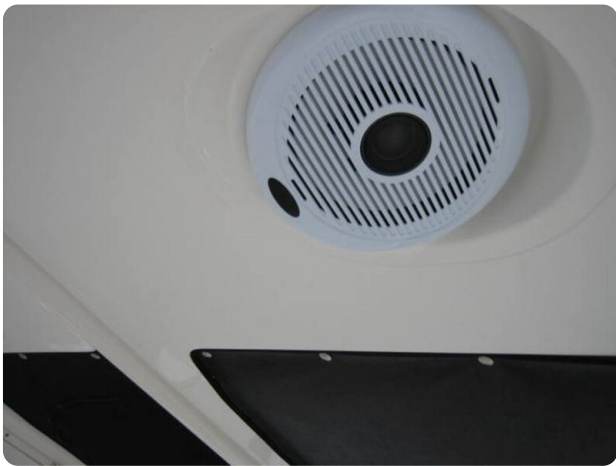
Pursuit S310 detail