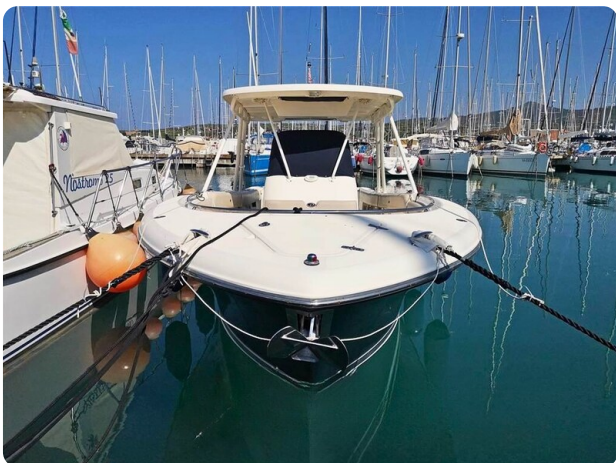
Pursuit 310 Sport Bow