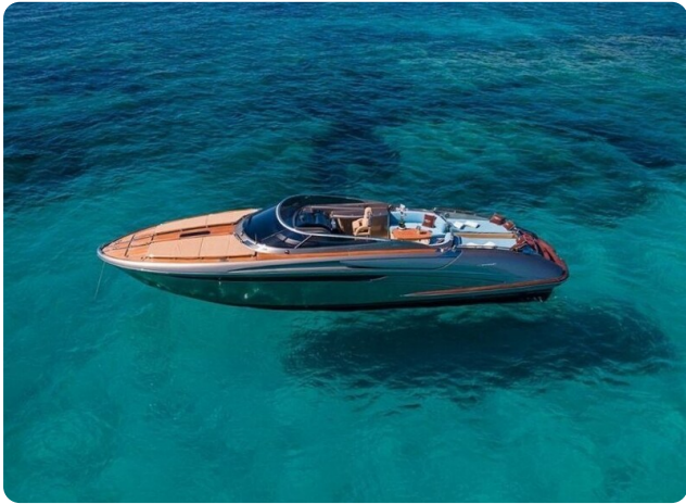
Rivarama Aerial 3