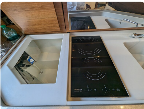
Rivarama galley detail