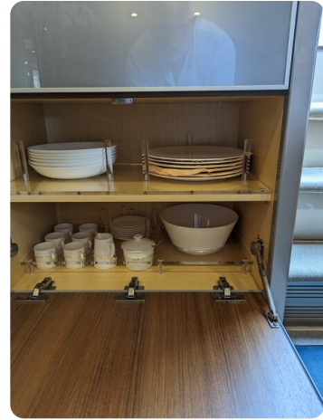
Rivarama Riva details