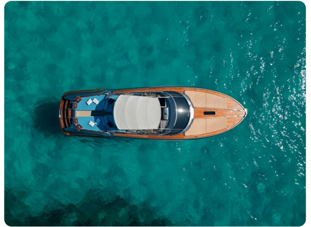
Rivarama Top View