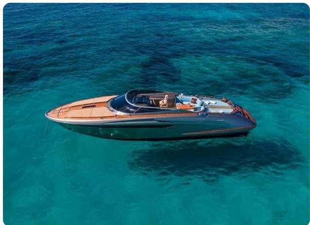
Rivarama Aerial 3