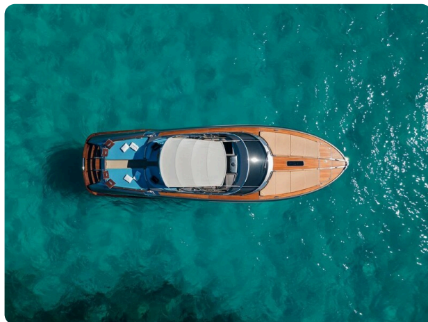
Rivarama Top View