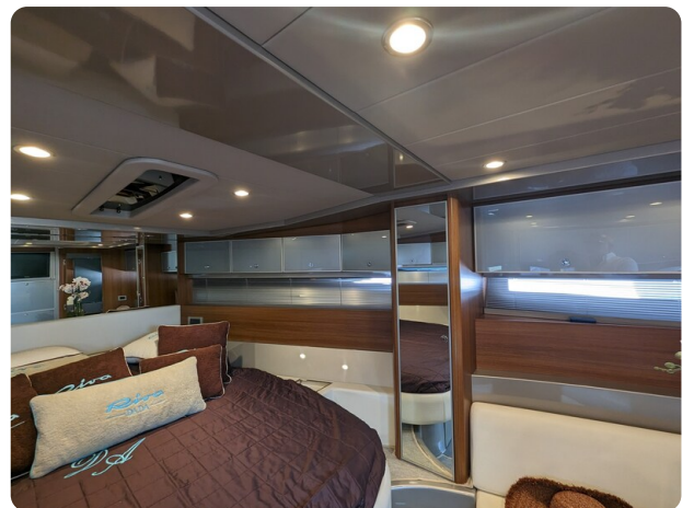
Rivarama interior details