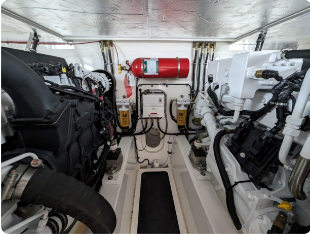
Riviera 45 Fly engine room