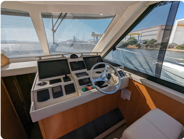
Riviera 45 Fly helm station detail