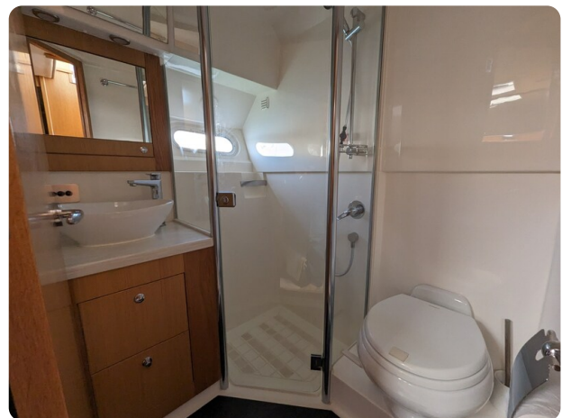
Riviera 45 Fly guest bathroom