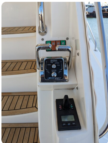
Riviera 45 Fly cockpit controls