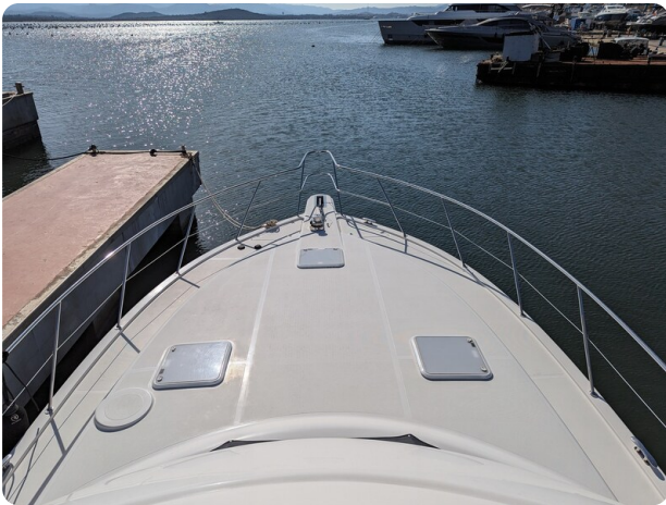
Riviera 45 Fly fwd deck