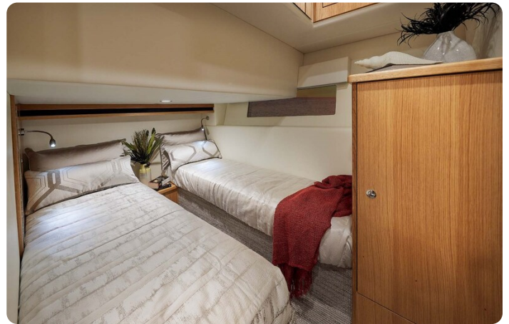
Riviera 45 Fly guest cabin, convertible