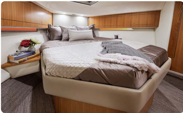
Riviera 45 Open Flybridge owner's cabin