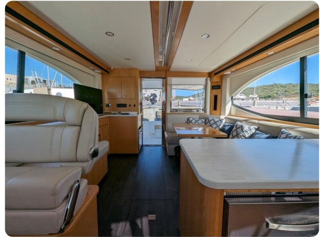
Riviera 45 Fly salon to aft