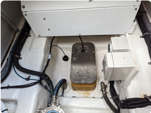
Riviera 45 Fly echo transducer