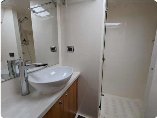
Riviera 45 Fly owner's bathroom