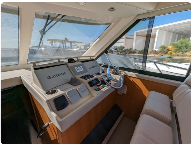
Riviera 45 Fly helm station