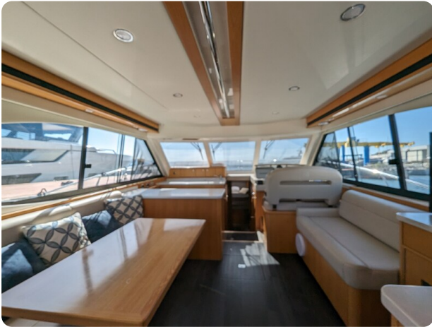
Riviera 45 Fly salon view