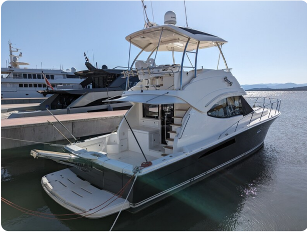
Riviera 45 Fly aft profile