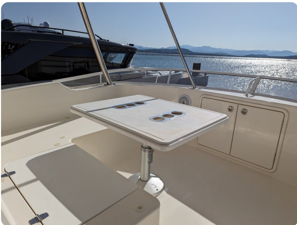
Riviera 45 Fly upper dinette