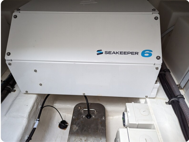
Riviera 45 Fly Seakeeper