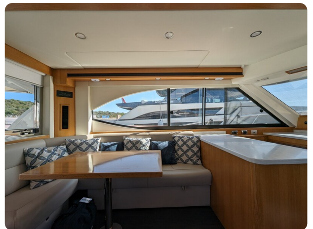
Riviera 45 Fly dinette