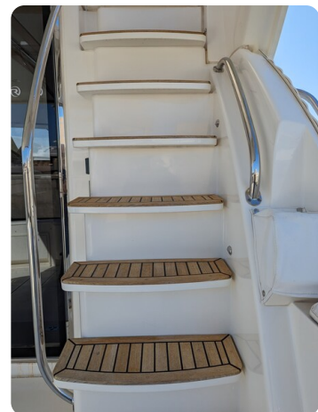
Riviera 45 Fly stairs