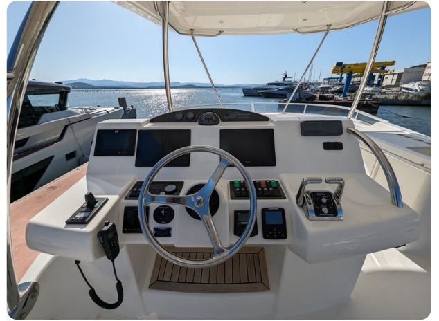
Riviera 45 Fly upper Helm