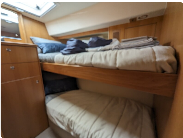
Riviera 45 Fly pullman berth cabin