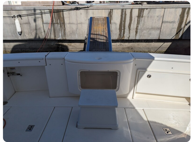
Riviera 45 Fly live baitwell