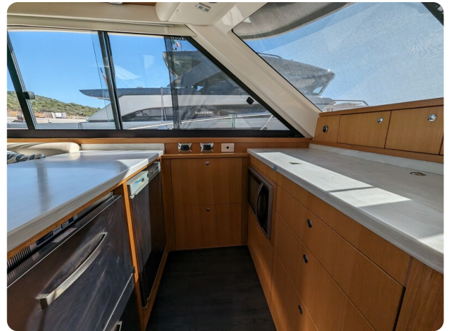
Riviera 45 Fly galley