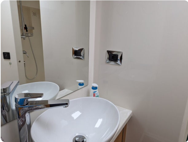
Riviera 45 Fly guest bathroom