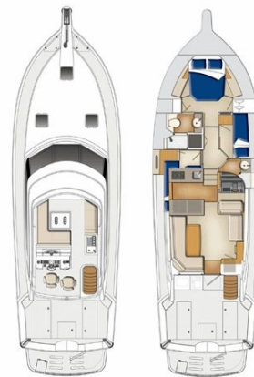
Riviera 45 Fly layout