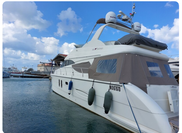
Rodman Yacht 64 Belisa, profile2