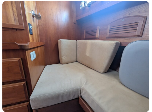
Sabre 42 Express convertible second cabin