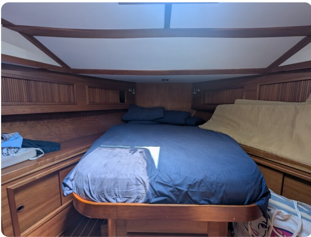
Sabre 42 Express owner's berth