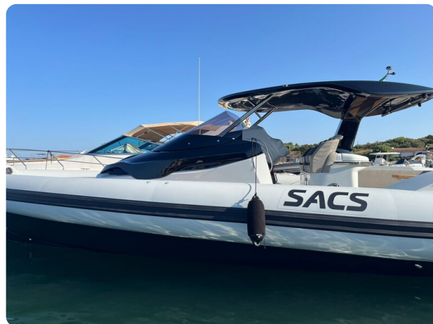
sacs strider 15-36