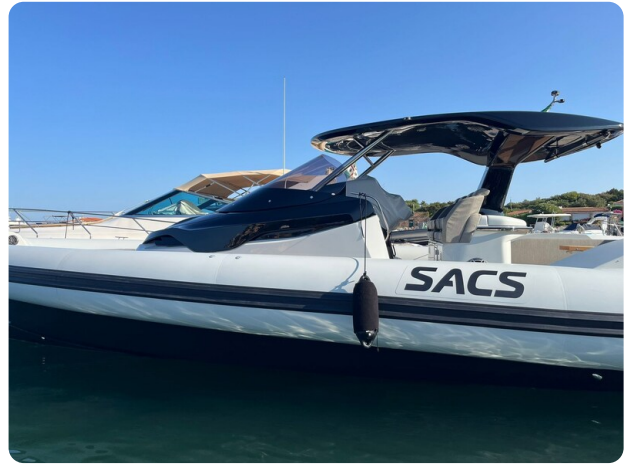
sacs strider 15-36