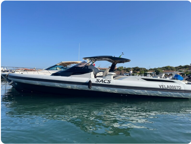
sacs strider 15-45