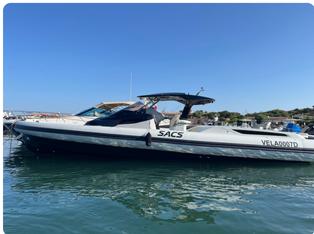
sacs strider 15-45