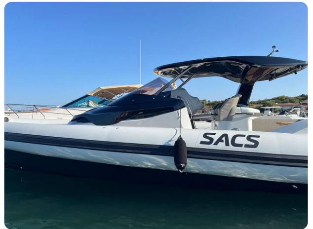
sacs strider 15-36