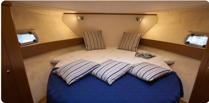
Saga 390 HT