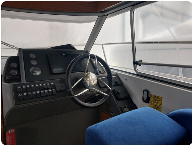
Saga 390 HT .jpg