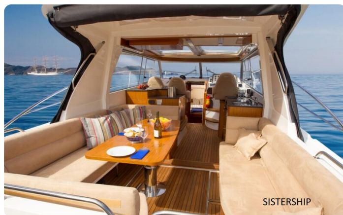
Saga 390 HT Sistership 2.jpg