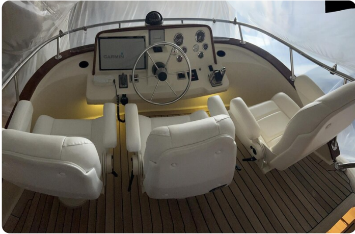
San Juan 40 Fly helm view