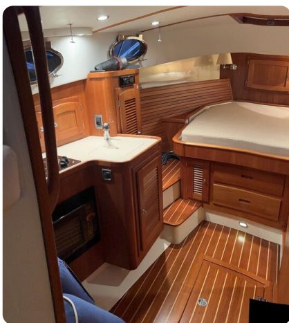
San Juan 40, lower deck