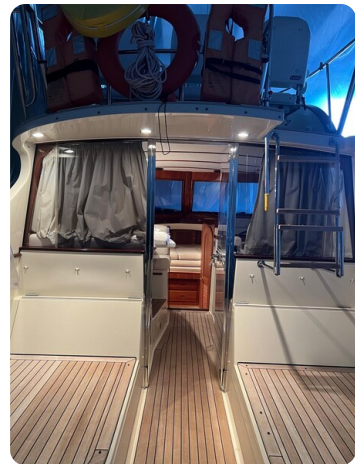
San Juan 40, cockpit view