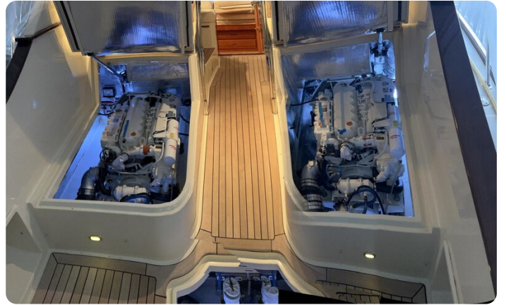
San Juan 40, engine room view