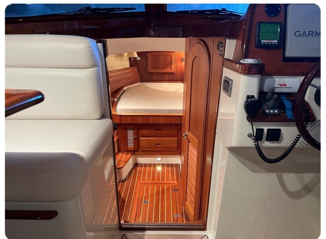
{1} Lower deck access