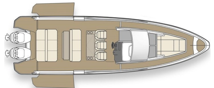
{L} deck layout