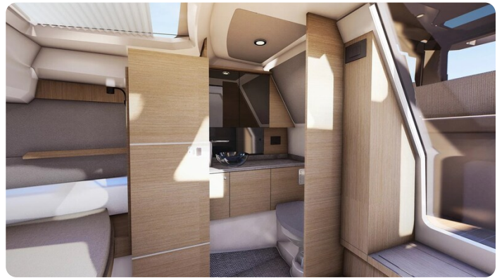
Saxdor 340 WA head