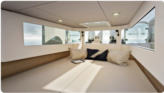
Saxdor 340 WA cabin