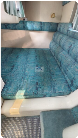
Sealine 28 Sport 52