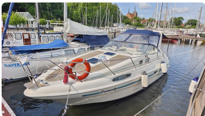
Sealine 28 Sport 6