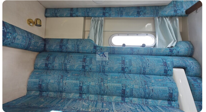
Sealine 28 Sport 61