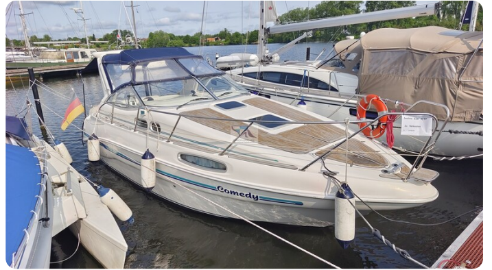
Sealine 28 Sport 10