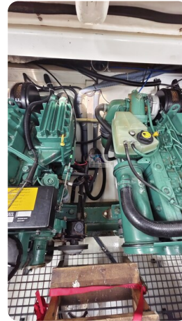
Sealine 28 Sport 67