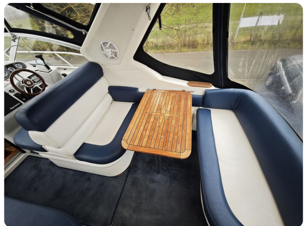
Sealine 28 BELLA 45