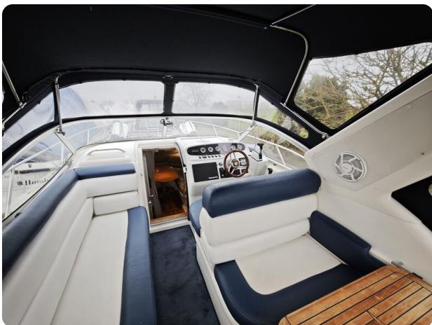
Sealine 28 BELLA 44