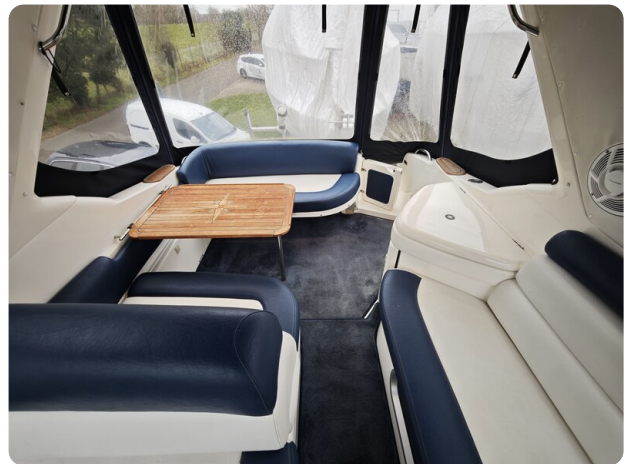
Sealine 28 BELLA 40