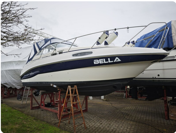
Sealine 28 BELLA 61