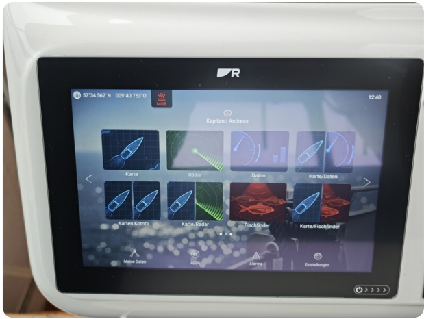
Sealine 28 BELLA 13