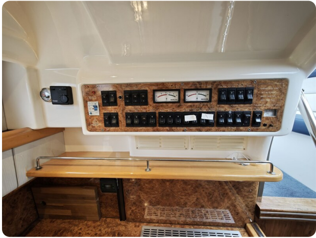
Sealine 28 BELLA 38