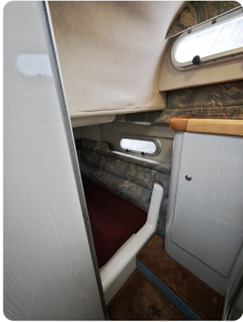
Sealine 28 BELLA 30