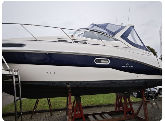
Sealine 28 BELLA 64