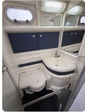
Sealine 28 BELLA 25