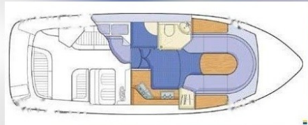
Layout Sealine 28 Sport