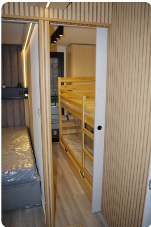
Shogun Hausboot 10m 9