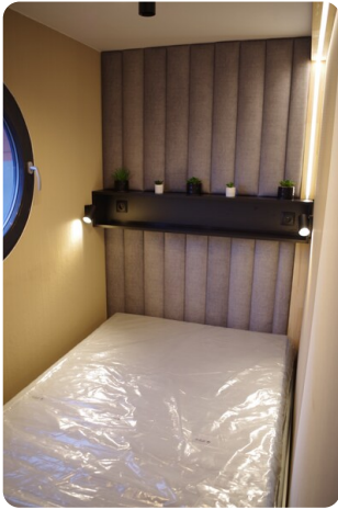
Shogun Hausboot 10m 3