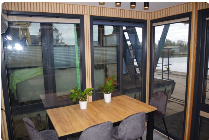
Shogun Hausboot 1000 4