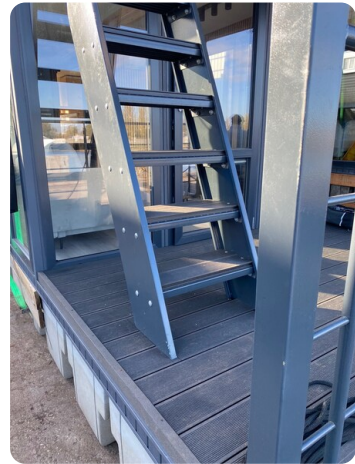
Shogun Hausboot 1000 3