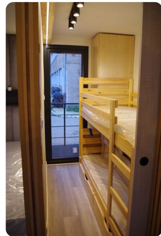
Shogun Hausboot 1000 11