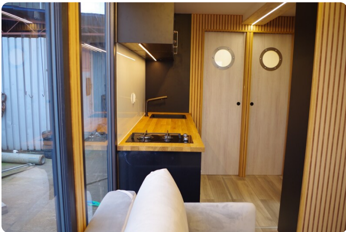
Shogun Hausboot 1000 21