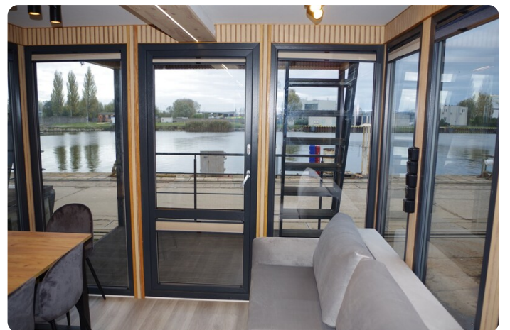
Shogun Hausboot 1000 5