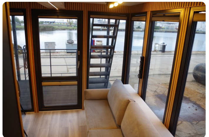
Shogun Hausboot 1000 18