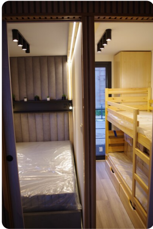
Shogun Hausboot 1000 8