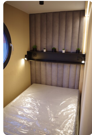
Shogun Hausboot 1000 7