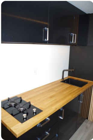
Shogun Hausboot 1000 6