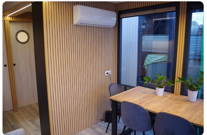
Shogun Hausboot 1000 22