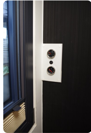
Shogun Hausboot 1000 16