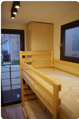
Shogun Hausboot 1000 10