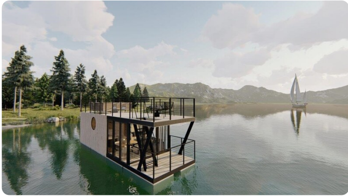
Shogun Hausboot 1000 1