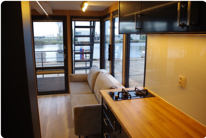
Shogun Hausboot 1000 19