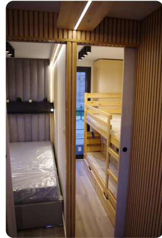
Shogun Hausboot 1000 9