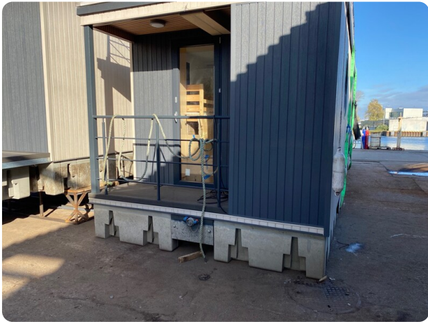
Shogun Hausboot 1000 2