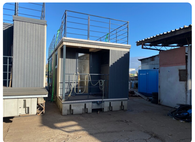
Shogun Hausboot 1000 14