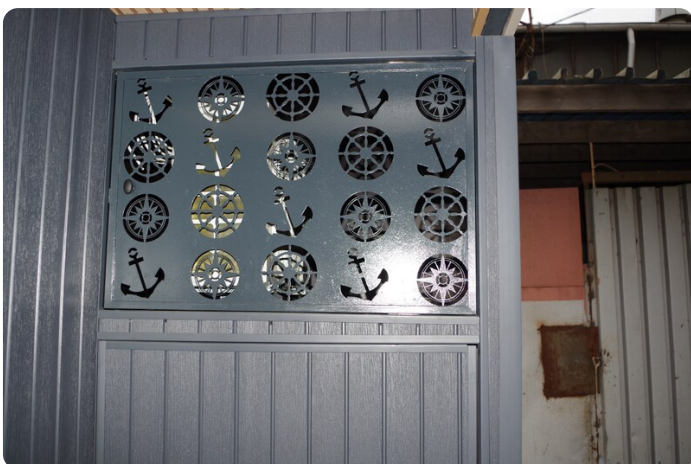
Shogun Hausboot 1000 23