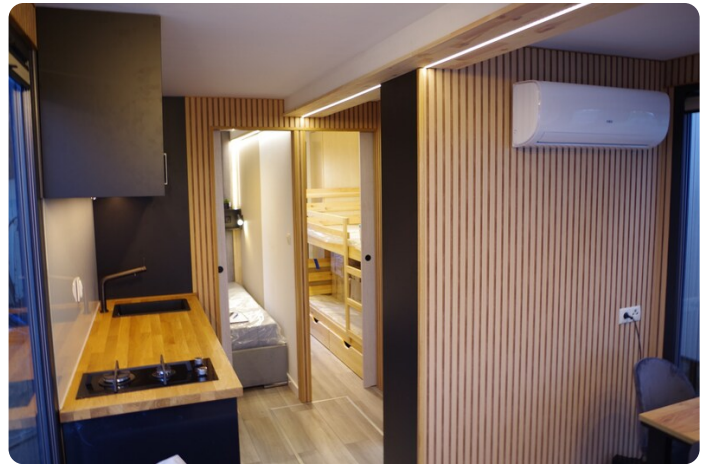
Shogun Hausboot 1000 20