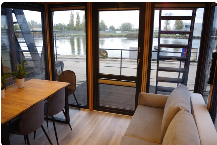
Shogun Hausboot 1000 17