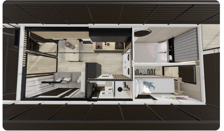
Shogun Hausboot 1000 Layout