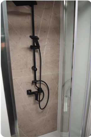
Shogun Hausboot 1000 15