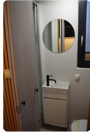
Shogun Hausboot 1000 13