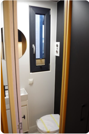
Shogun Hausboot 1000 12