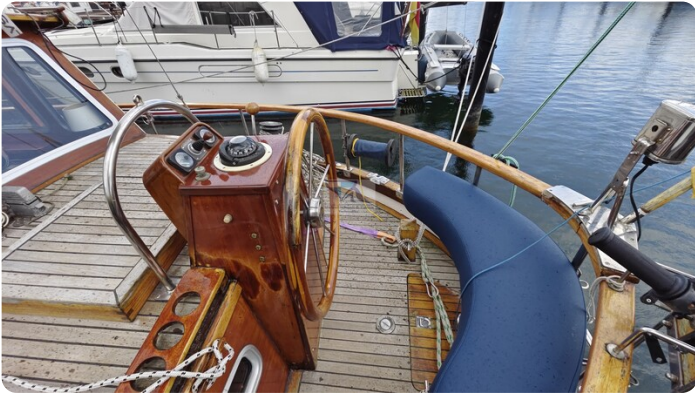
Nauticat 33 NORDSTRAND 76