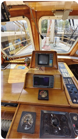
Nauticat 33 NORDSTRAND 31