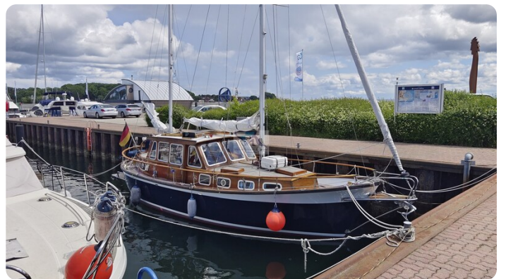
Nauticat 33 NORDSTRAND 3