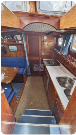
Nauticat 33 NORDSTRAND 40