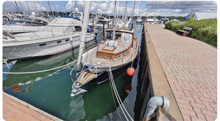
Nauticat 33 NORDSTRAND 6