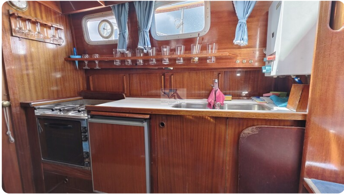
Nauticat 33 NORDSTRAND 47