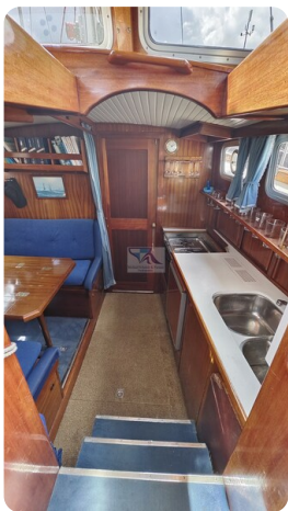
Nauticat 33 NORDSTRAND 40