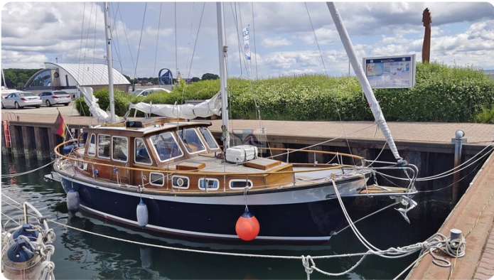
Nauticat 33 NORDSTRAND 2