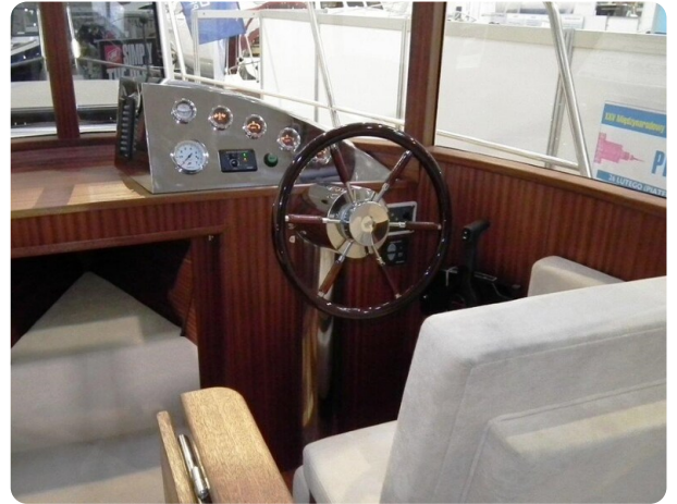
Hausboot SM 30 msp-398859 (19)