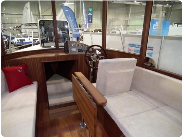
Hausboot SM 30 msp-398859 (18)