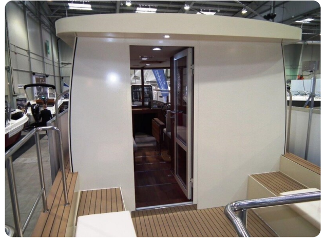
Hausboot SM 30 msp-398859 (16)