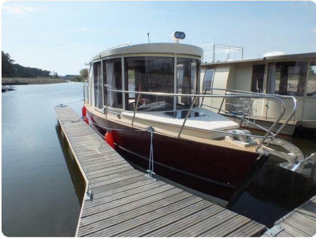
Hausboot SM 30 msp-398859 (24)