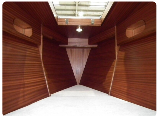
Hausboot SM 30 msp-398859 (21)