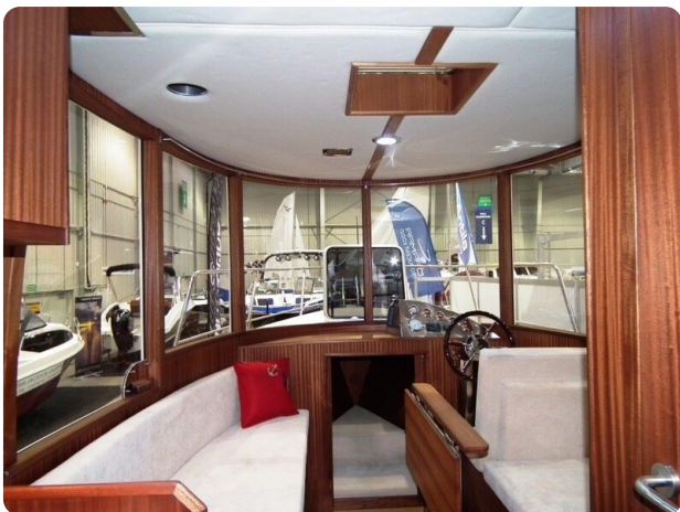
Hausboot SM 30 msp-398859 (20)