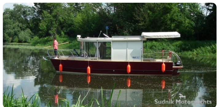
Hausboot SM 30 msp-398859 (22)