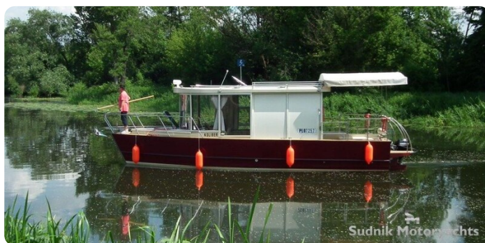
Hausboot SM 30 msp-398859 (22)