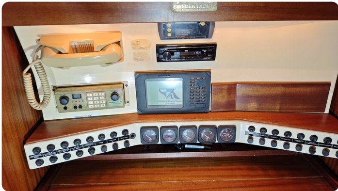
Sweden 340 SPITZMAUS 6