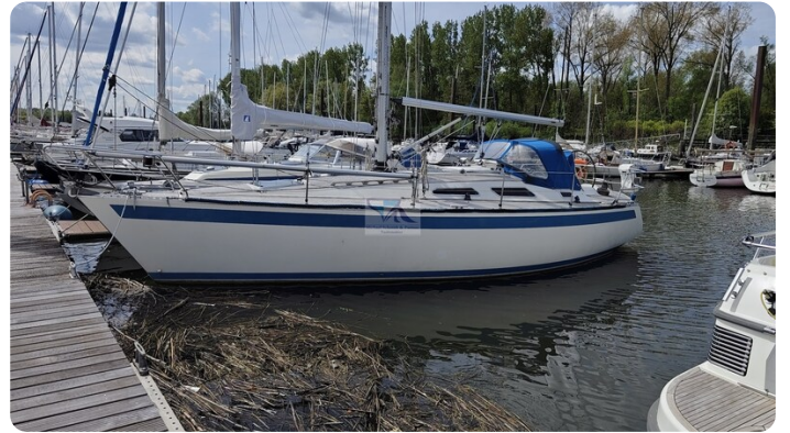
Sweden 340 SPITZMAUS IW 2