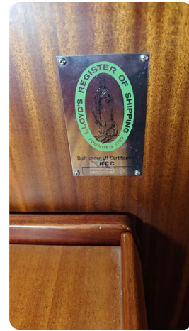
Sweden 340 SPITZMAUS 59