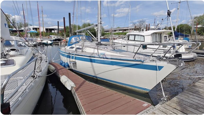
Sweden 340 SPITZMAUS IW 6