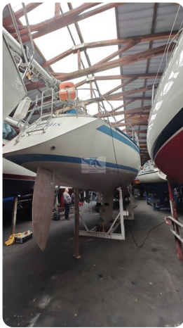
Sweden 340 SPITZMAUS 17