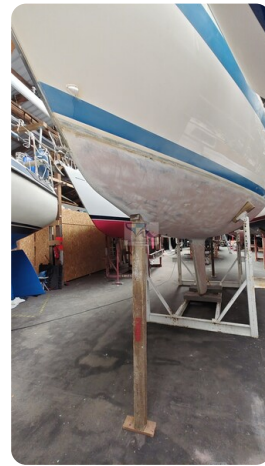
Sweden 340 SPITZMAUS 15