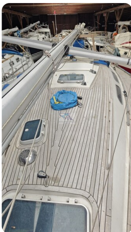
Sweden 340 SPITZMAUS 1