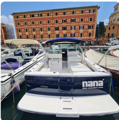
Tiara 2900 Coronet transom