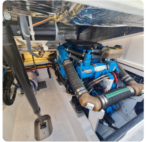
Tiara 2900 Coronet stbd engine