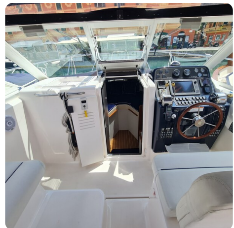
Tiara 2900 Coronet cabin door