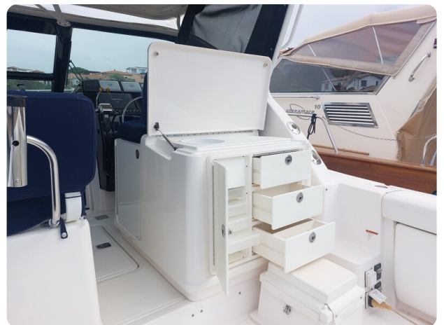
Tiara 3200 Open cockpit prep center