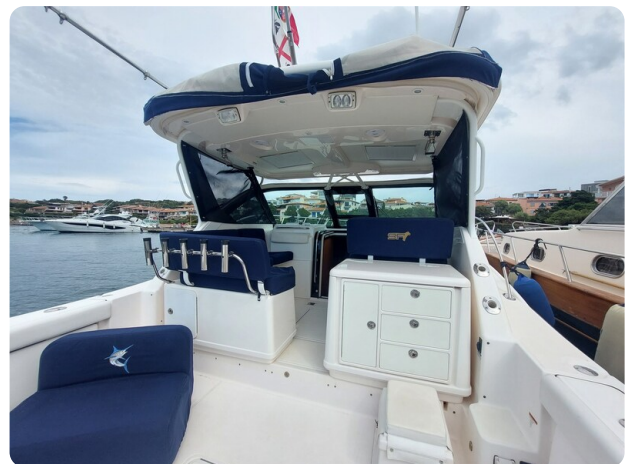
Tiara 3200 Open cockpit view