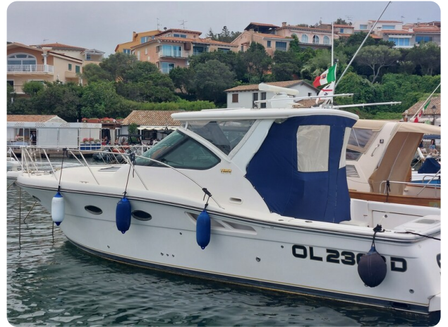
Tiara 3200 Open, aft profile