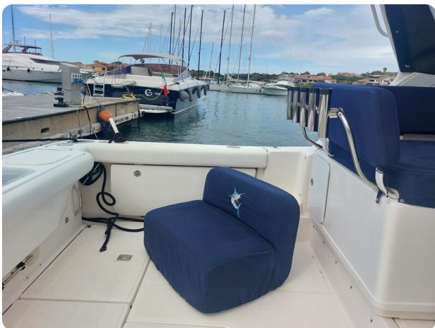
Tiara 3200 Open, cockpit