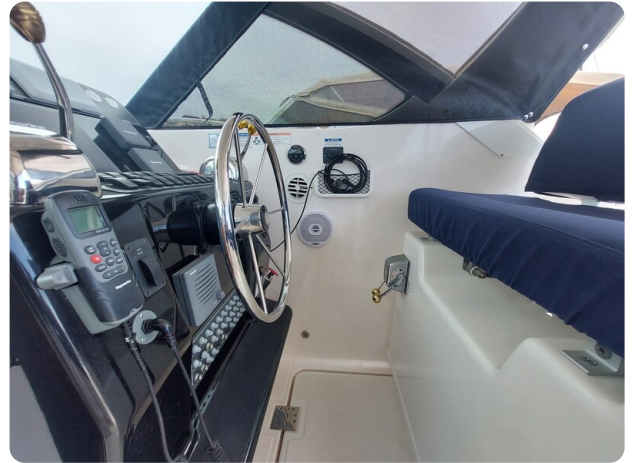
Tiara 3200 Open helm station