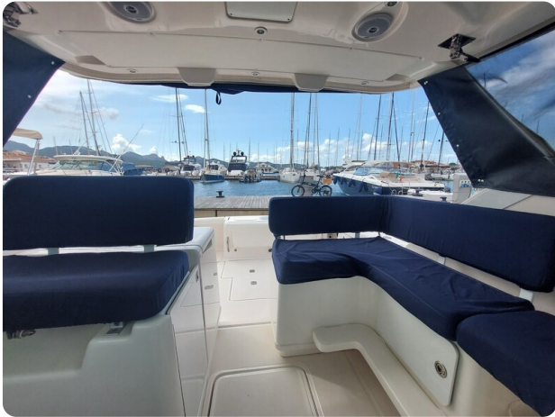
Tiara 3200 Open cockpit dinette