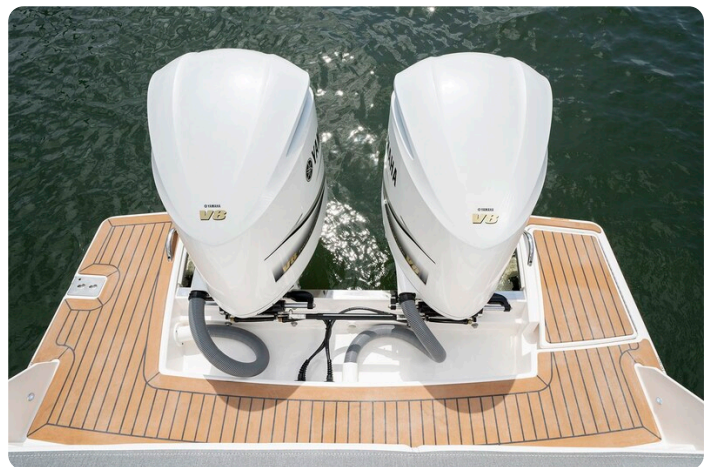
Tiara 34 LX platform