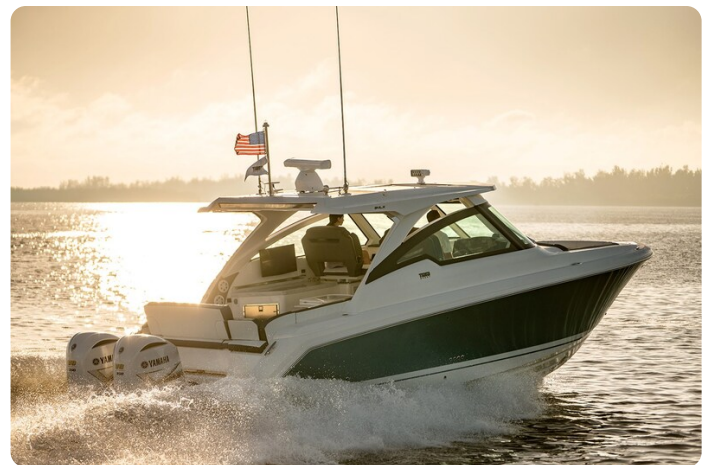
Tiara 34 LX running 2