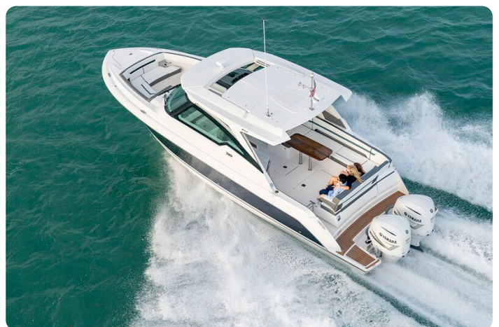
Tiara 34 LX Sport cruising