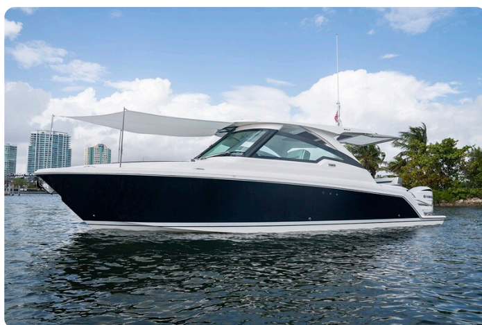
Tiara 34 LX bow profile