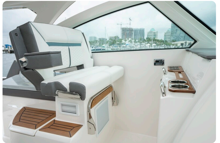
Tiara 34 LX port seat