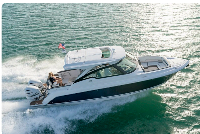
Tiara 34 LX cruising