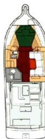
Tiara 3500 layout