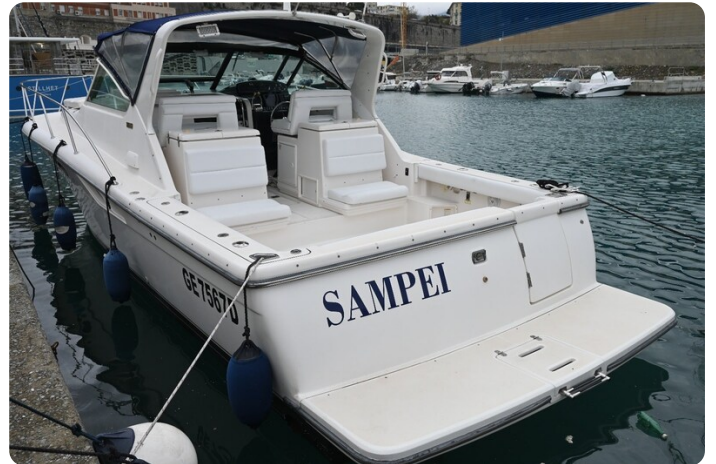
Tiara 3500 Open Sampei aft profile 2