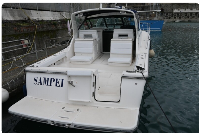
Tiara 3500 Open Sampei stern view