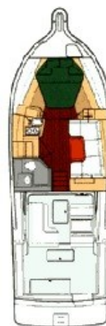
Tiara 3500 layout