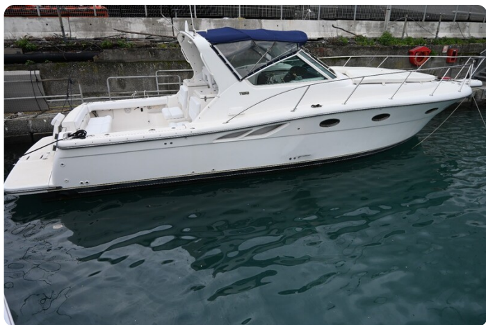
Tiara 3500 Open Sampei profile