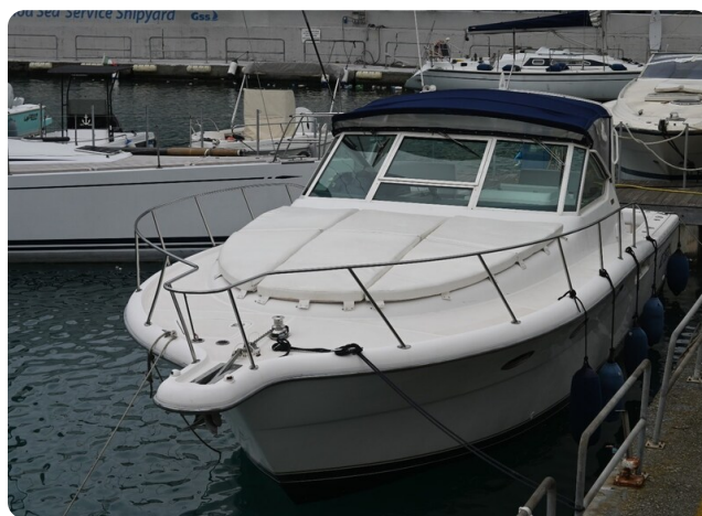
Tiara 3500 Open Sampei bow view