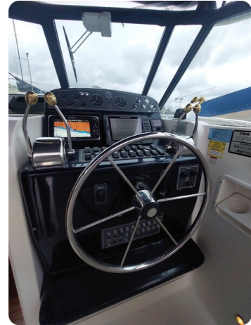
Tiara 3500 Open Sampei helm station