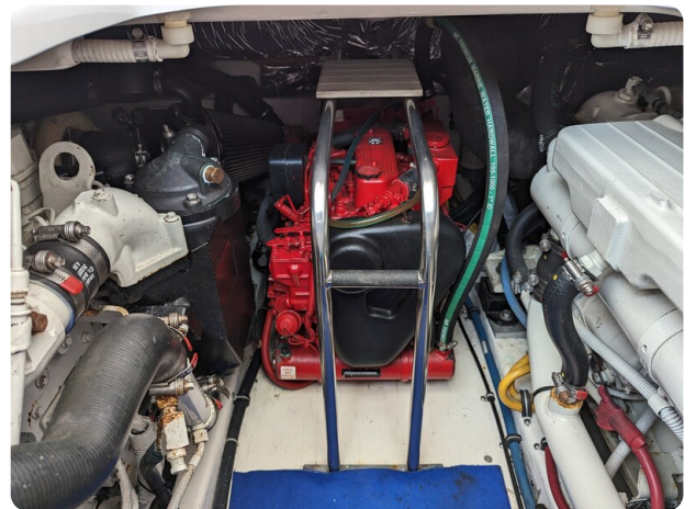
Tiara 3600 Open engine room