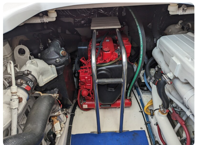
Tiara 3600 Open generator