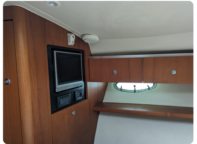
Tiara 3600 Open master cabin's TV