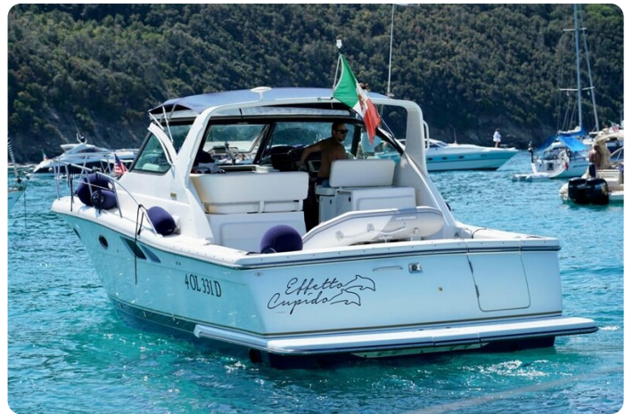
Tiara 3800 Open Stern