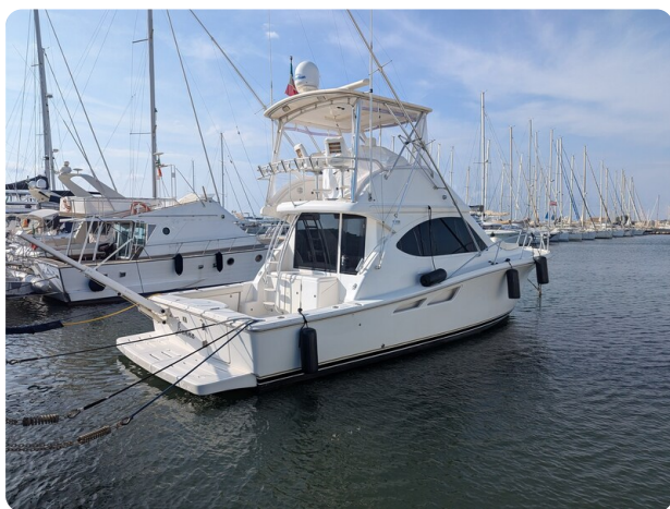
Tiara 3900 Conv. profile