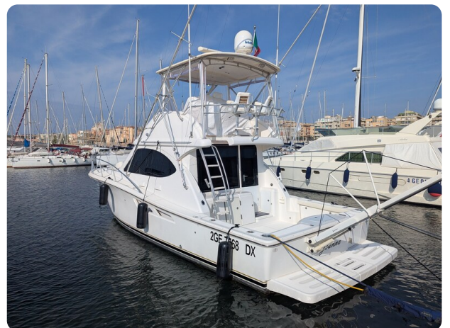
Tiara 3900 Conv. aft profile