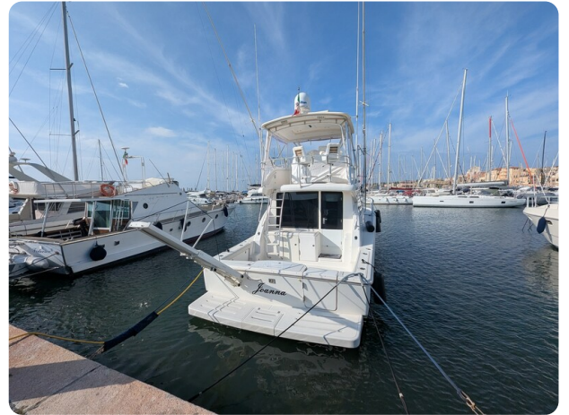
Tiara 3900 Conv. stern view