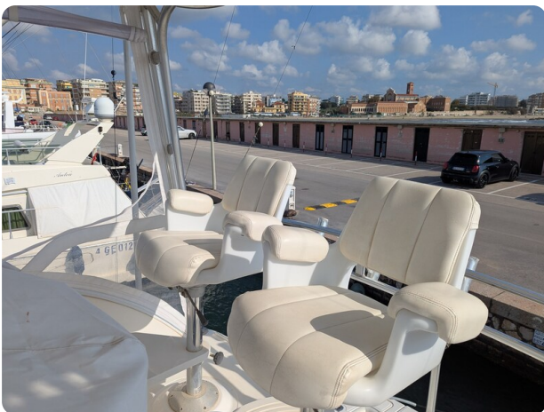
Tiara 3900 Conv. Fly seats