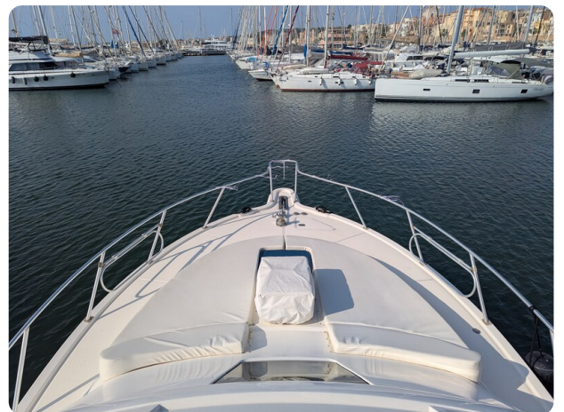
Tiara 3900 Conv. bow sunpad