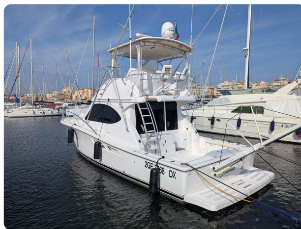
Tiara 3900 Conv. aft profile