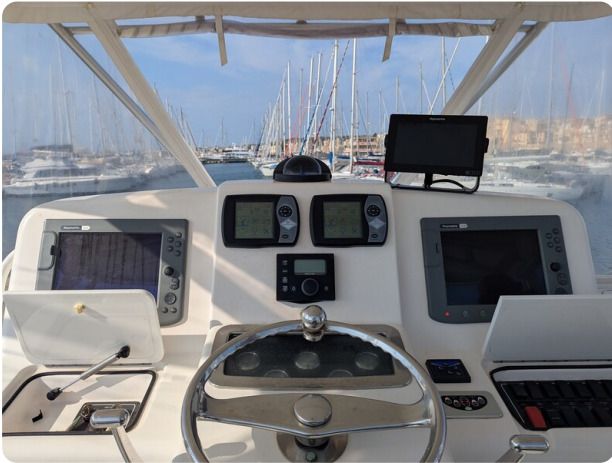
Tiara 3900 Conv. Helm station