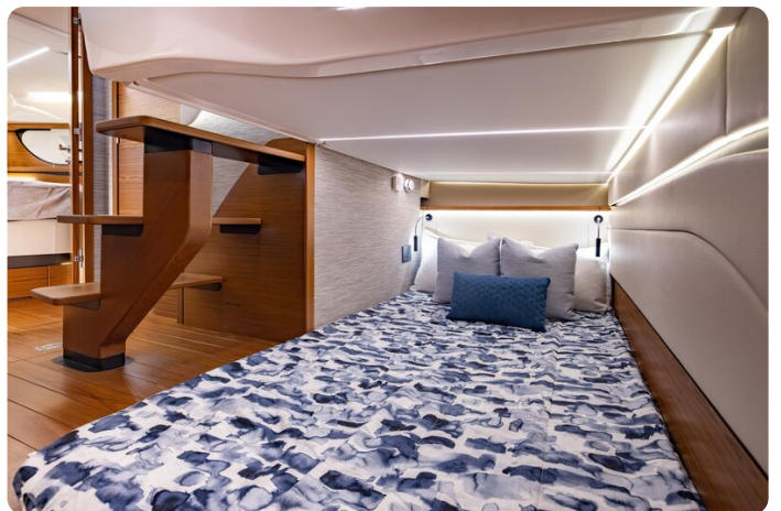
{1} Aft berth