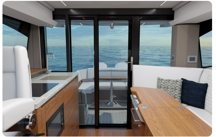
43le-rendering-interior-Salon with Doors Closed