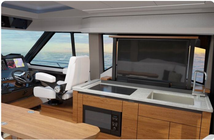
Tiara 43LE galley with TV up