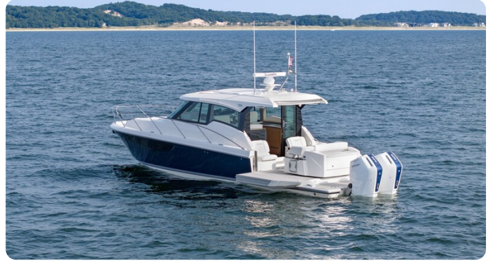
43 LE Nav