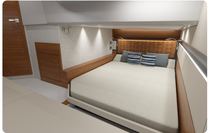
Tiara 43LE aft cabin