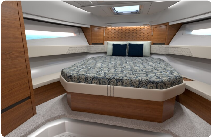
Tiara 43LE owner's cabin