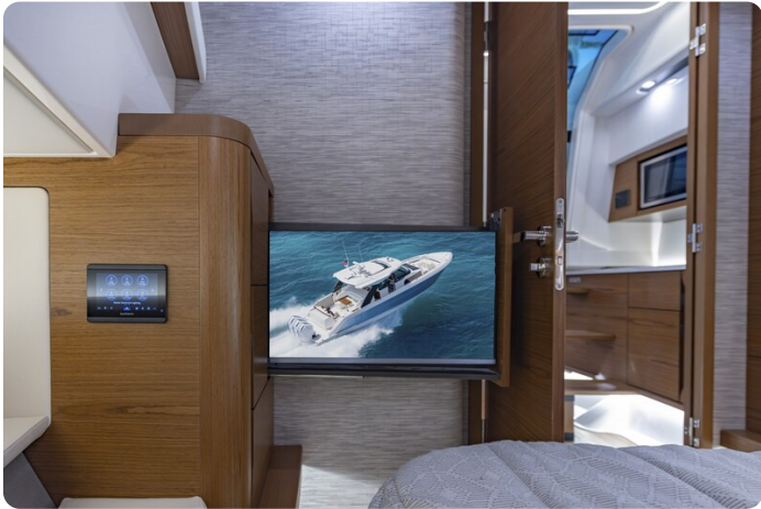
{1} Owner's cabin detail