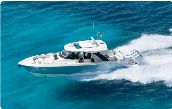
Tiara Yachts 46 LS