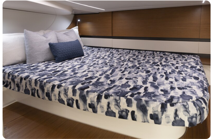
{1} Guest cabin