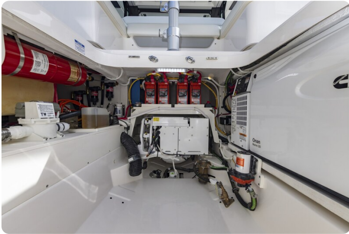
{I} Technical lazarette