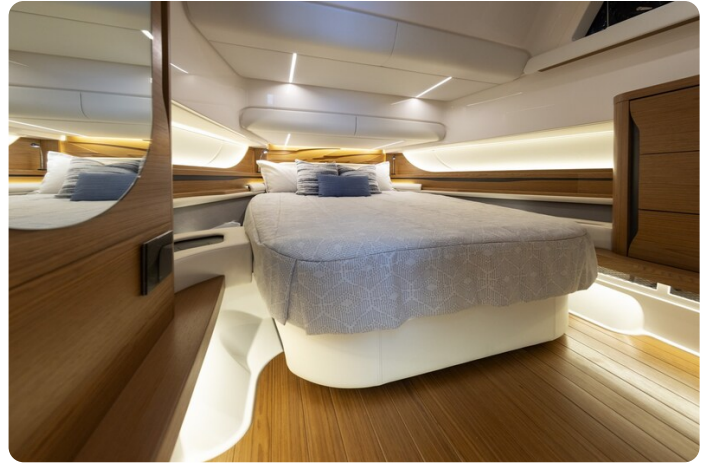
{1} Owner's cabin