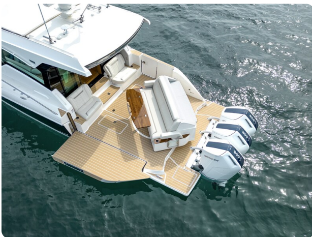
Tiara 48LE terrace detail