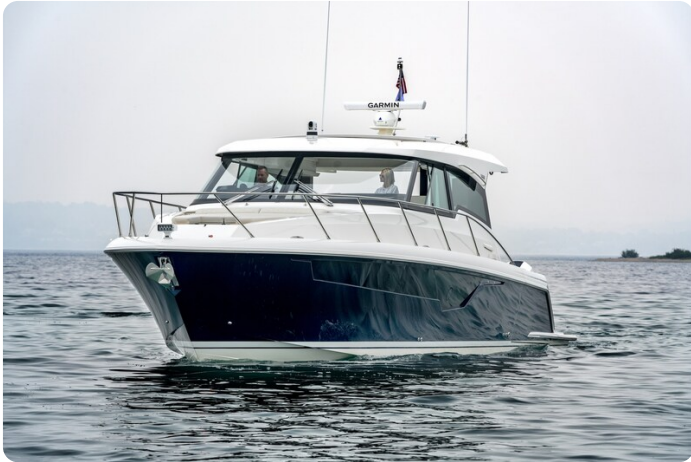
Tiara 48LE bow view