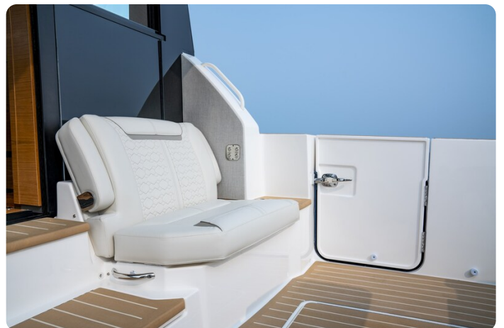
Tiara 48LE cockpit detail