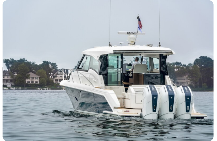
Tiara 48LE aft view