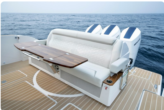
Tiara 48LE cockpit dinette