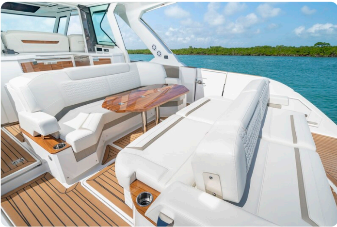
Tiara 48LS aft dinette