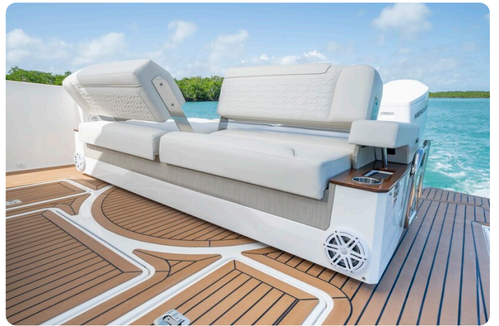
Tiara 48LS aft seats