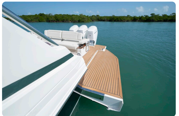
Tiara 48LS side platform