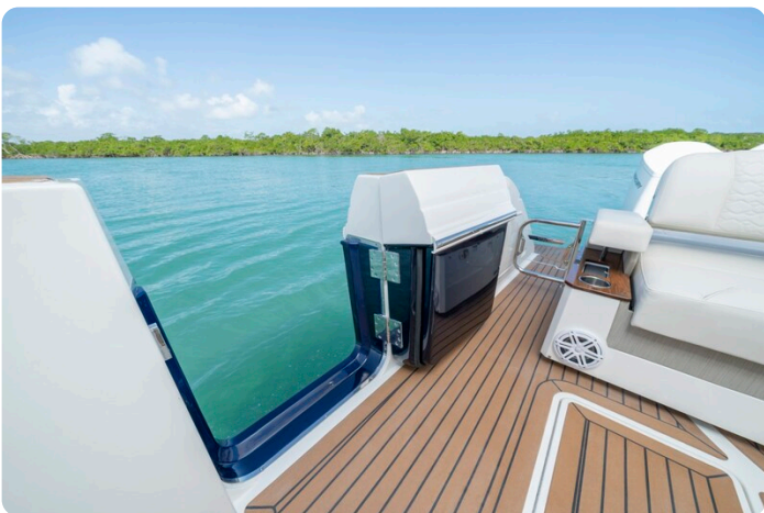
Tiara 48LS side door