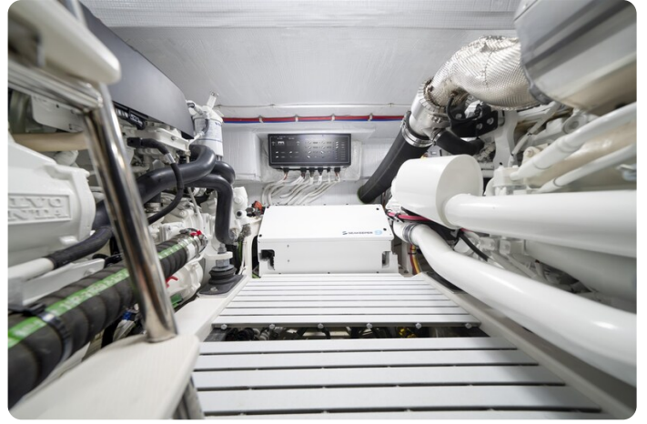
Tiara EX54 engine room detail