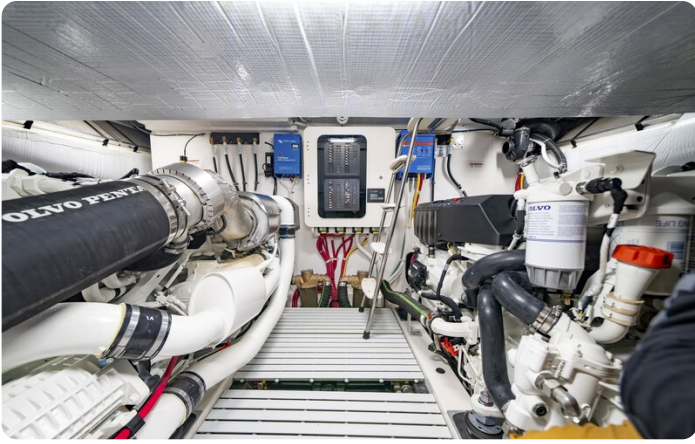
Tiara EX54 engine room