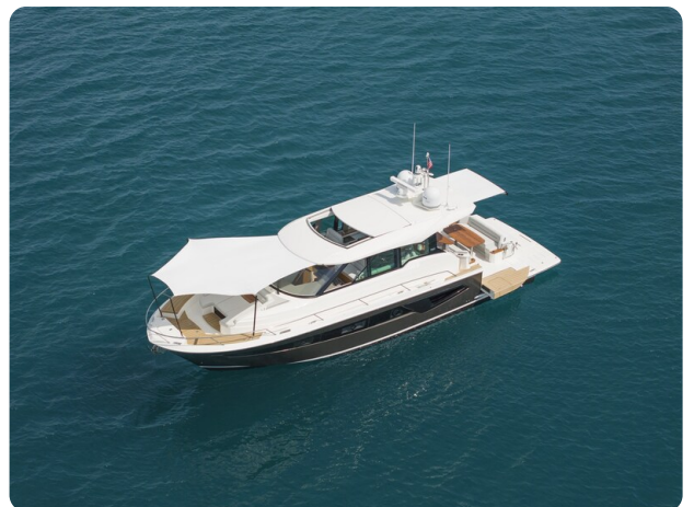
Tiara EX54 anchored