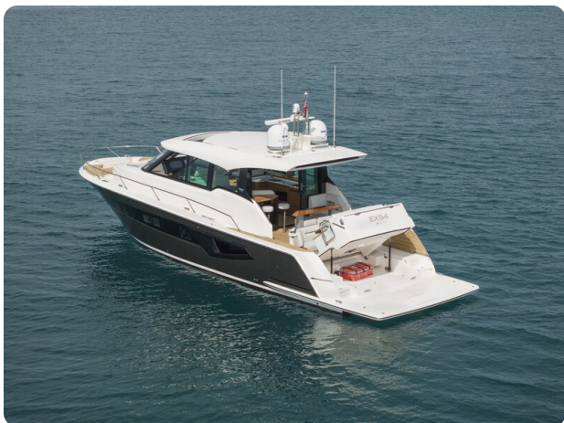
Tiara EX54 aft view