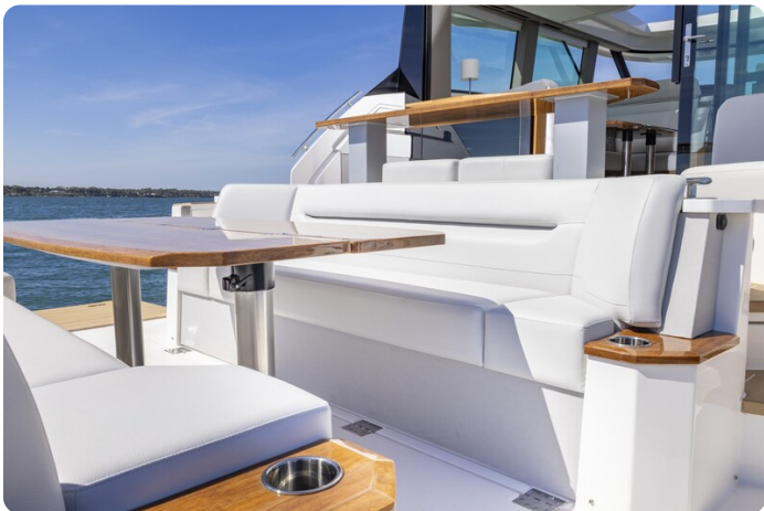
Tiara EX54 Aft Cockpit Lounge