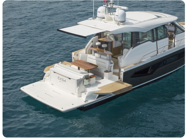
Tiara EX54 cockpit view