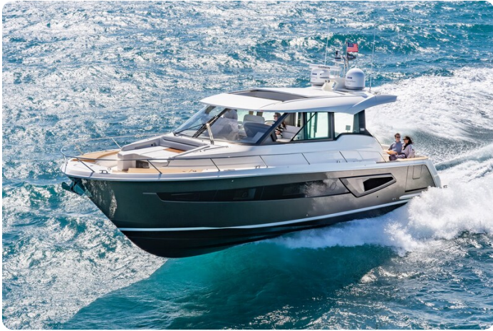
Tiara EX54 running