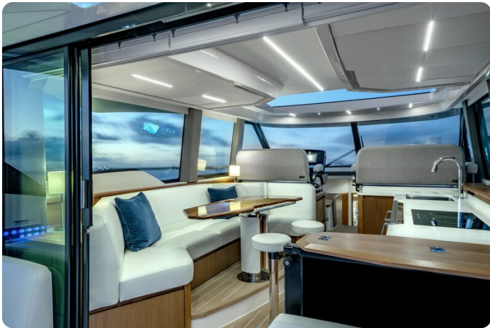
Tiara EX60 salon view