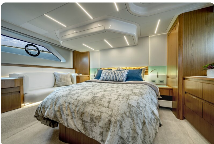
Tiara EX60 owner's cabin