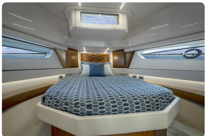
Tiara EX60 Vip cabin