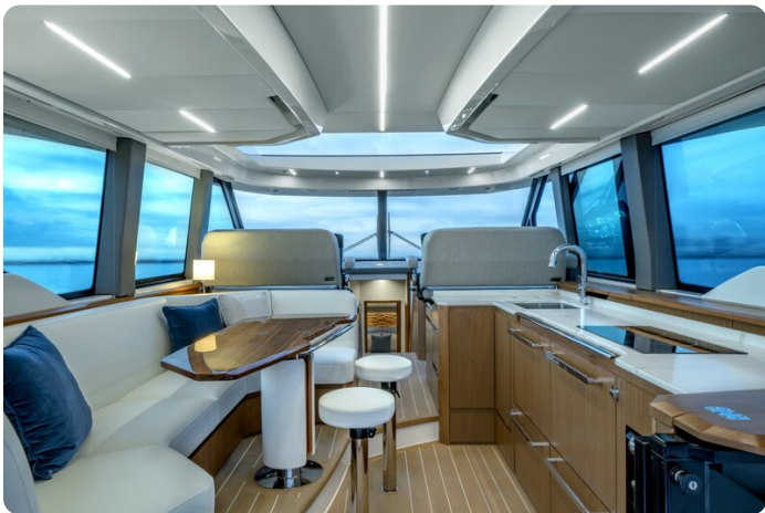
Tiara EX60 salon