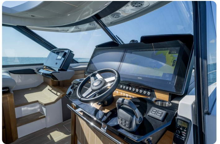
Tiara EX60 helm