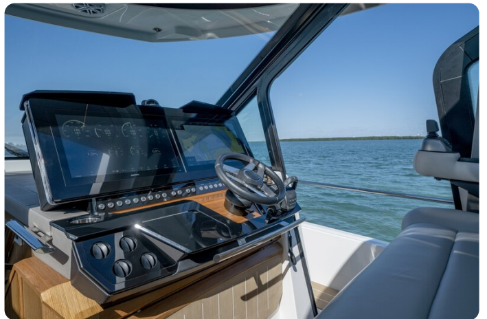
Tiara EX60 helm station