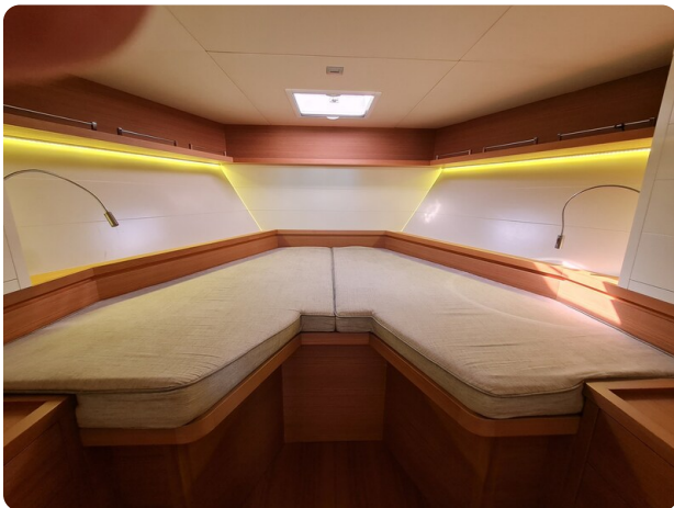
Toy Tender 47, master cabin