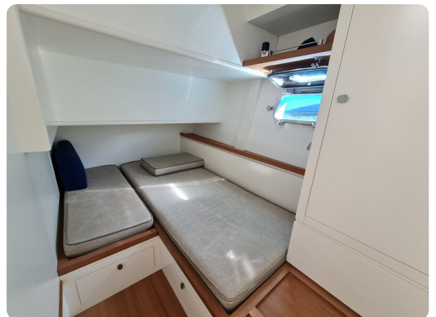
Toy Tender 47, guest cabin