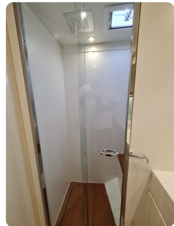
Toy Tender 47, shower