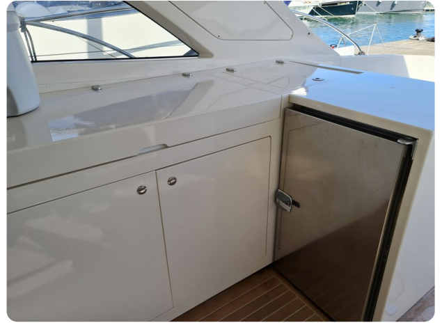
Toy Tender 47, galley