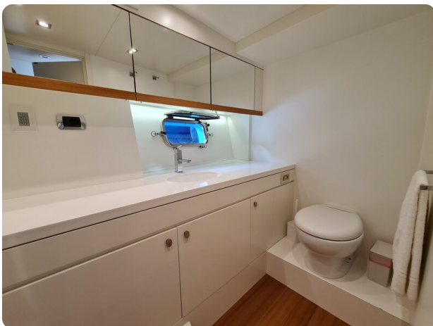
Toy Tender 47, bathroom