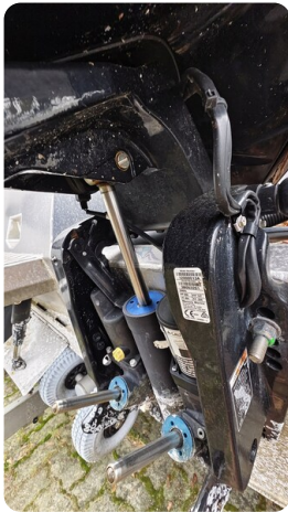
Voyager 700 Cabin_14