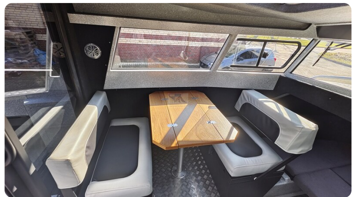
Voyager 700 Cabin_37