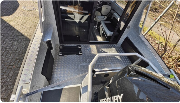
Voyager 700 Cabin_29