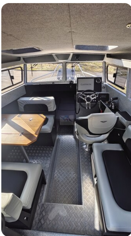
Voyager 700 Cabin_36