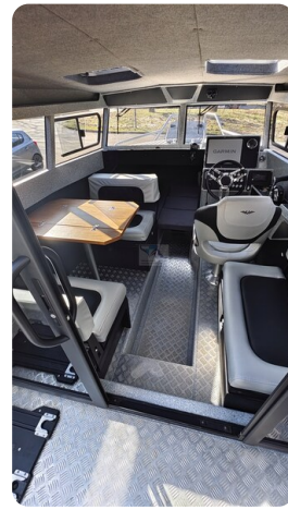
Voyager 700 Cabin_33