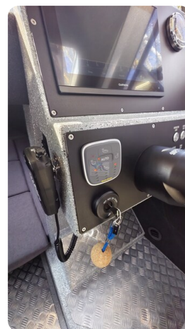
Voyager 700 Cabin_42