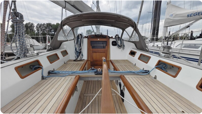
Helena 35 38