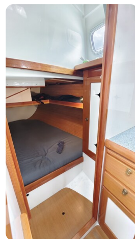
Helena 35 23