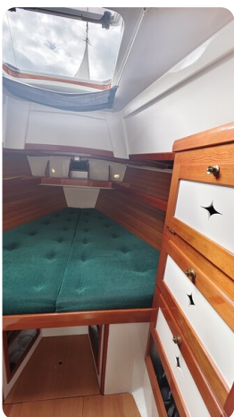
Helena 35 4