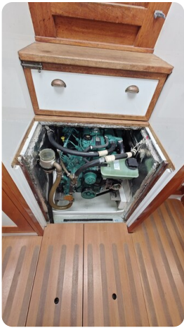
Helena 35 24