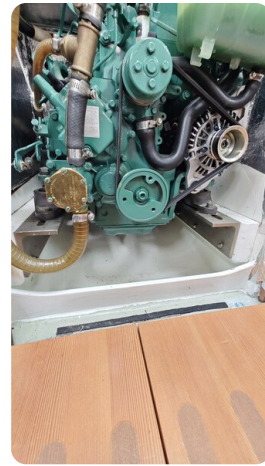
Helena 35 25