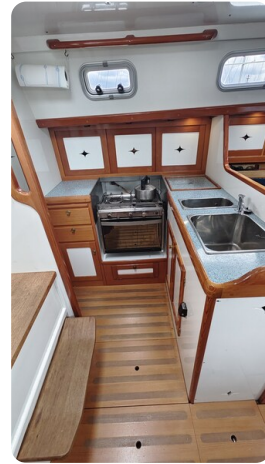
Helena 35 21