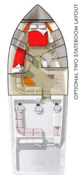
Viking 45' Open layout