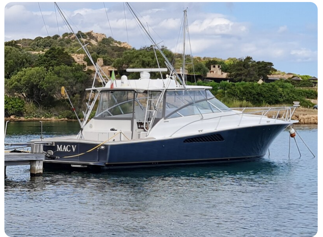
Viking 45 Open, aft profile