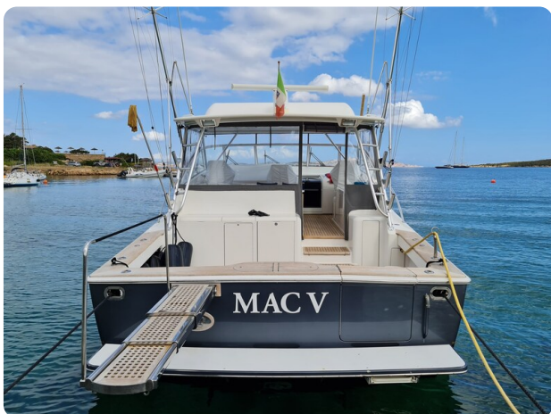
Viking 45 Open, stern view