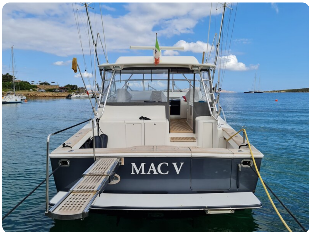
Viking 45 Open, stern view