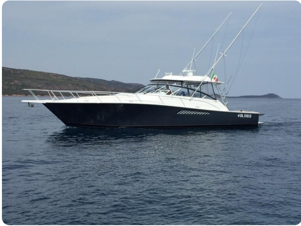
Viking 45 Open, profile