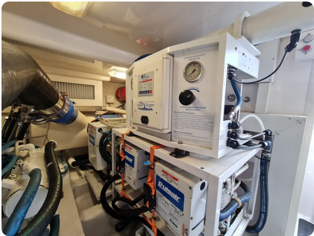
Viking 45 Open, engine room detail