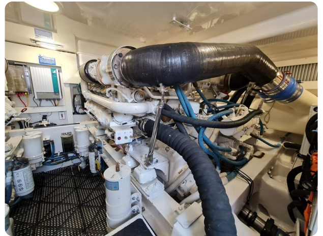
Viking 45 Open stbd engine