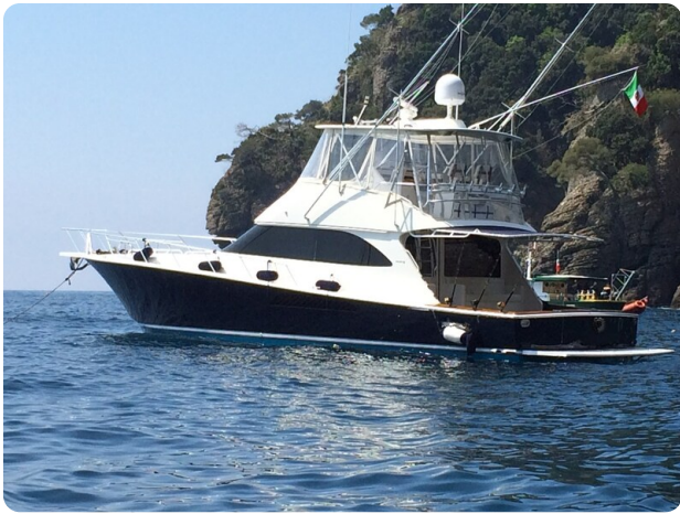
Viking 54 Anchored