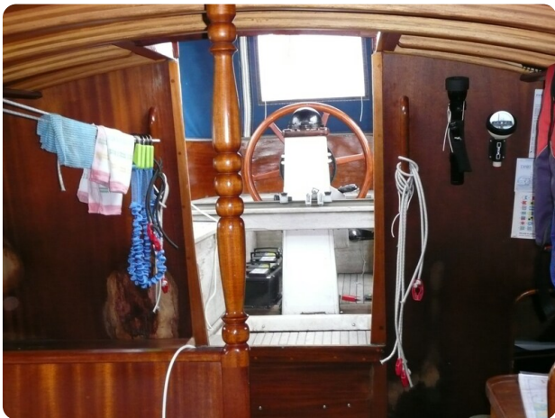
Vindö 50 msp269542 14