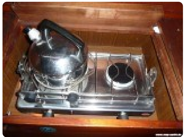
Vindö 50 msp269542 5