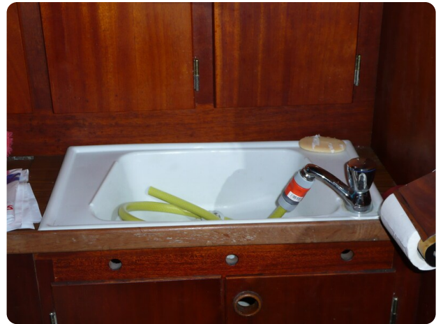
Vindö 50 msp269542 13