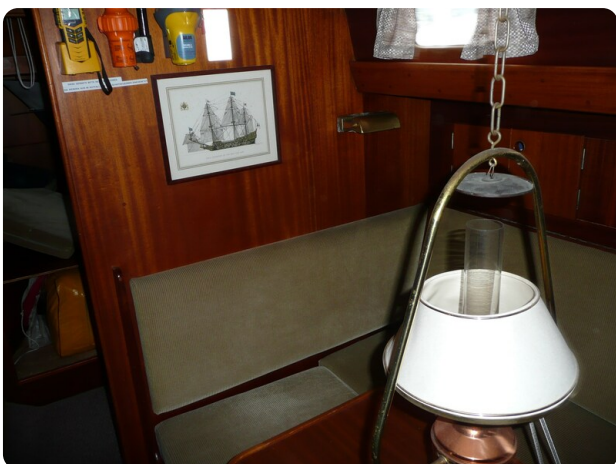
Vindö 50 msp269542 10