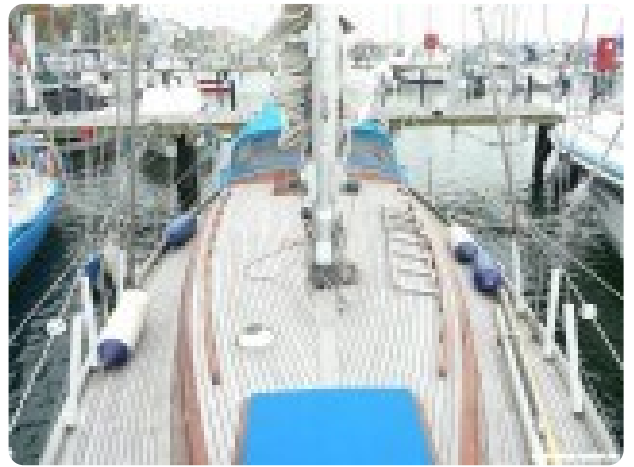
Vindö 50 msp269542 2