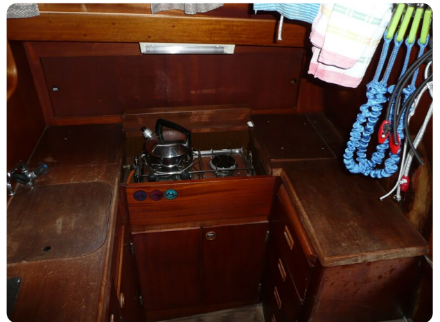
Vindö 50 msp269542 9