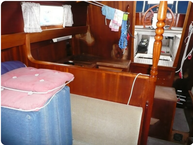
Vindö 50 msp269542 12