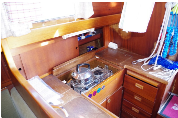
Vindö 50 msp269542 16