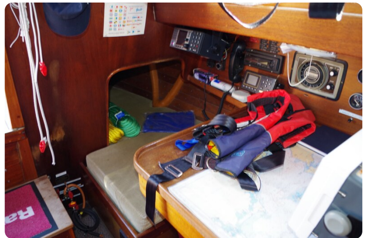
Vindö 50 msp269542 15