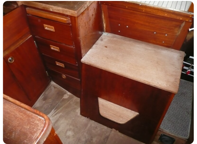
Vindö 50 msp269542 7