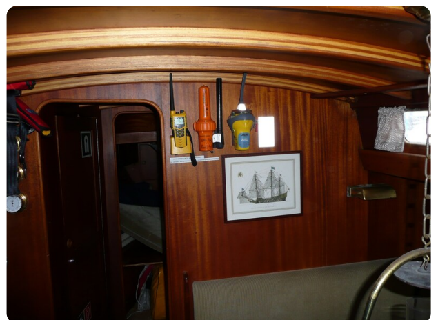
Vindö 50 msp269542 11