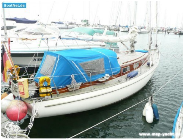
Vindö 50 msp269542 1