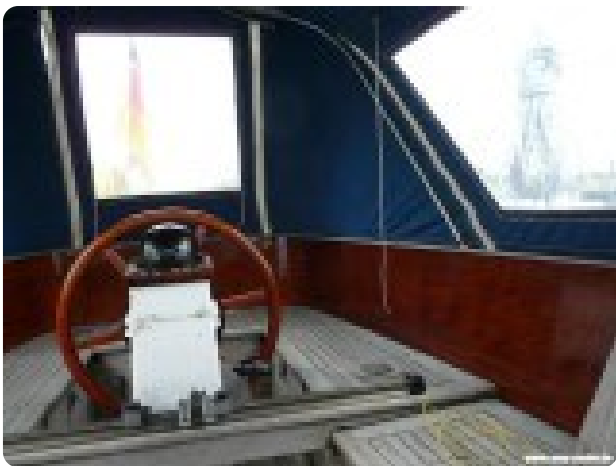
Vindö 50 msp269542 4