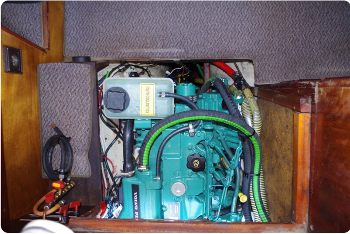
Vindö 50 msp269542 18