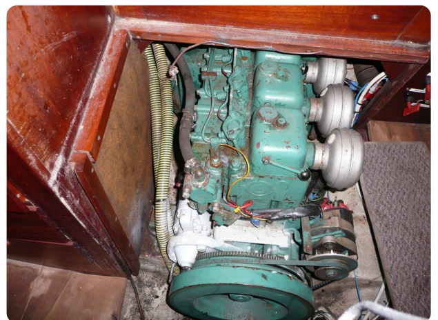
Vindö 50 msp269542 17