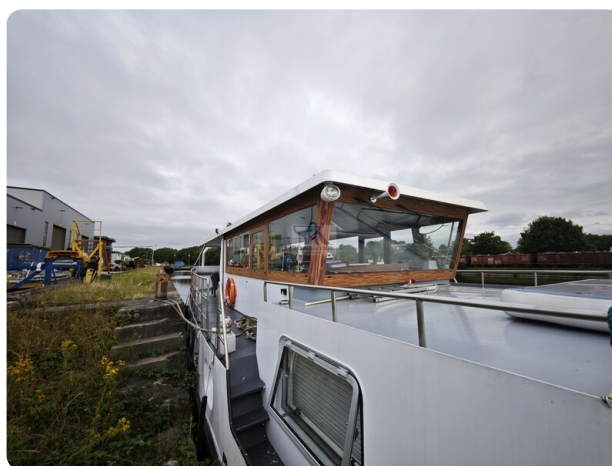
MY GINO 18