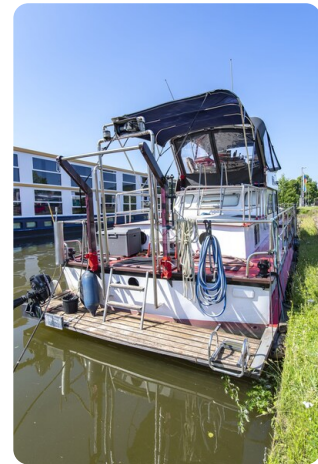
15m Stahlmotoryacht BERDA 20