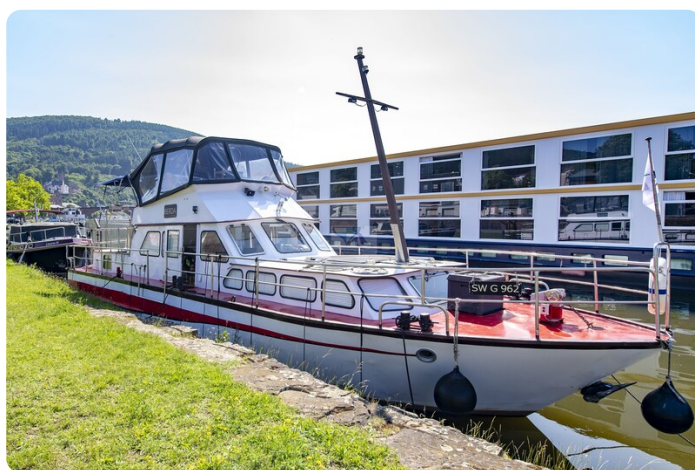
15m Stahlmotoryacht BERDA 24