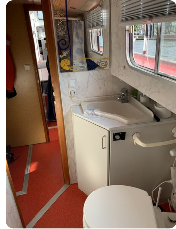
15m Stahlmotoryacht BERDA 36