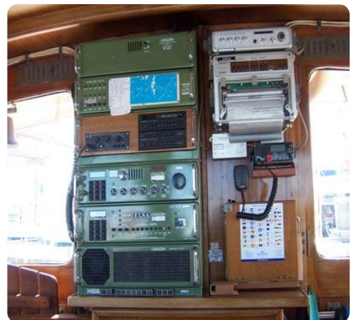
Lührsens Kutteryacht 21,50m msp256650 5