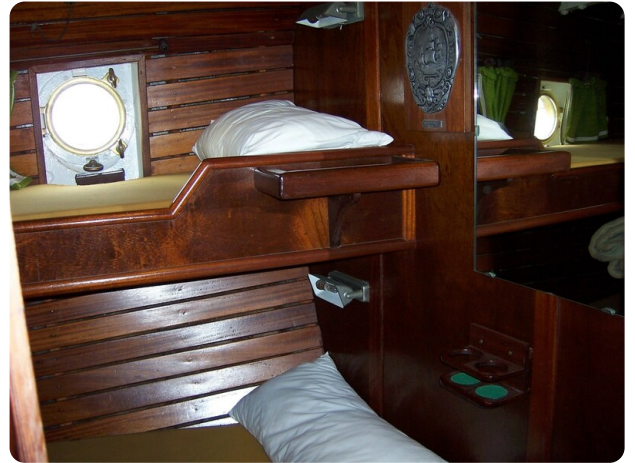
Lührsen Kutteryacht 21,50m msp256650 16