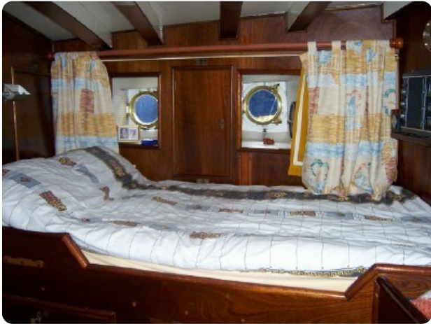
Lührsen Kutteryacht 21,50m msp256650 15