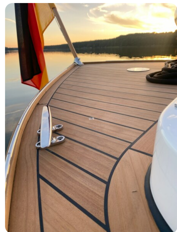
TUCK 22 2023 9