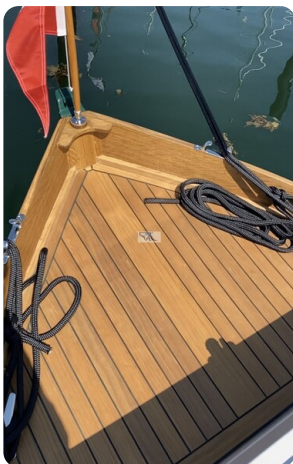
TUCK 22 2023 5