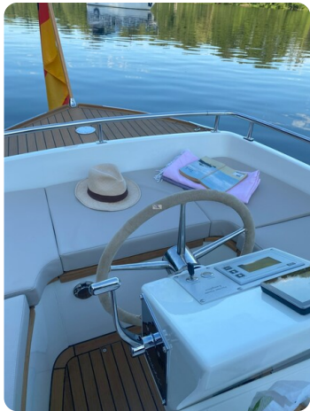
TUCK 22 2023 6