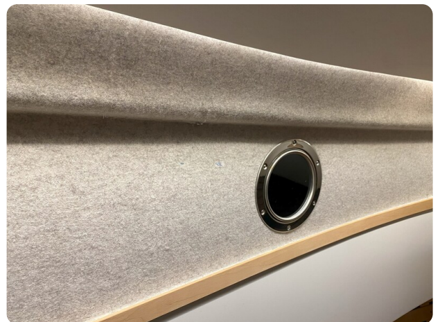
TUCK 22 2023 10