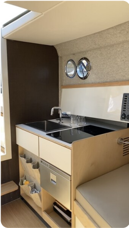
TUCK 22 2023 2