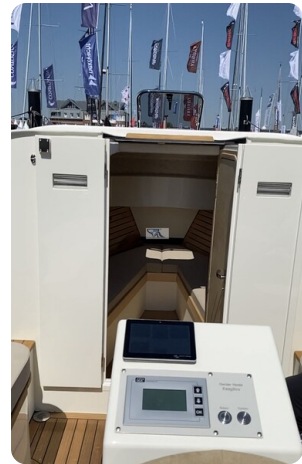
TUCK 22 2023 4