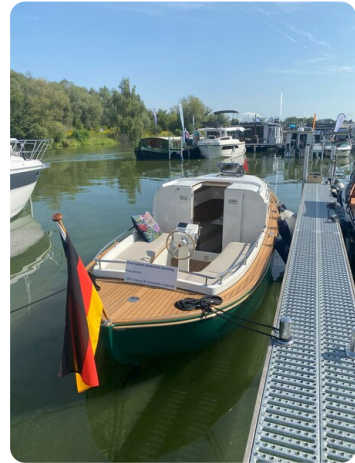
TUCK 22 2023 7