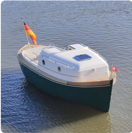
TUCK 22 2023 1