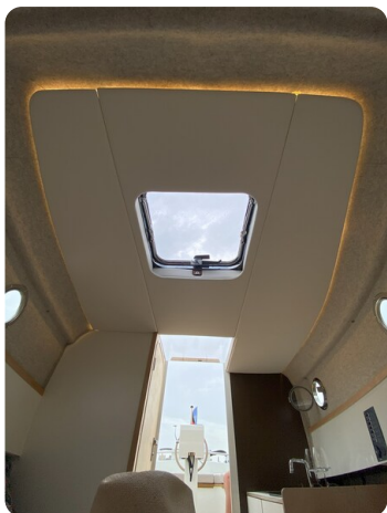
TUCK 22 2023 8