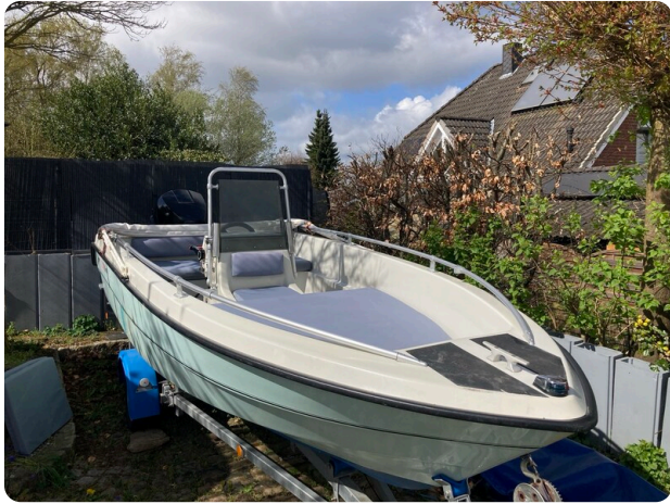
Big Fish 470 msp768487 1