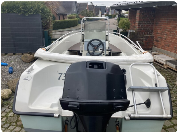
Big Fish 470 msp768487 3