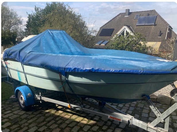
Big Fish 470 msp768487 5